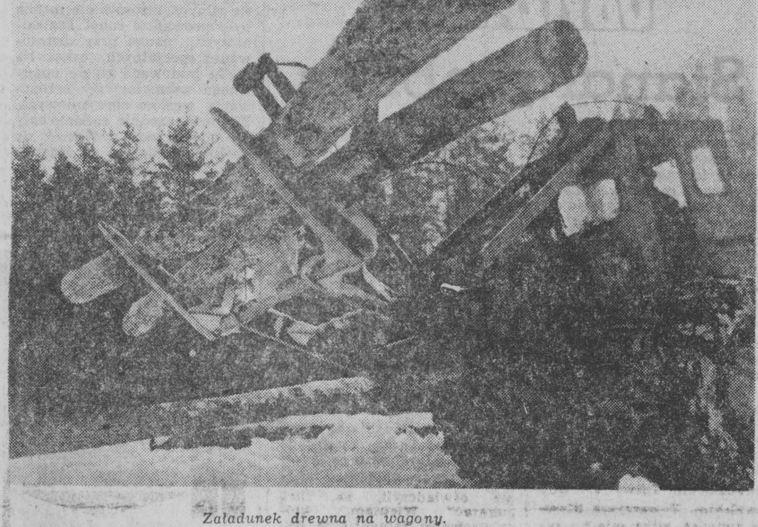
Załadunek drewna na wagony.