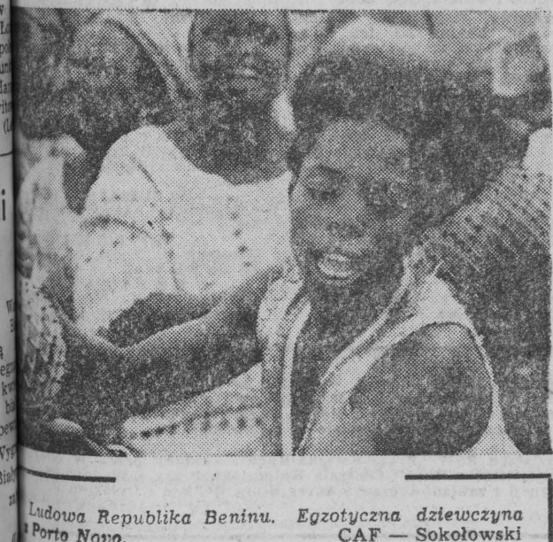
Ludowa Republika Beninu. Egzotyczna dziewczyna

Stwierdzenia te mają sporne znaczenie obecnie, kiedy nasiliły się różnorodne nęweiry białyńskich sprzyrzeńców, mające na celu odwołanie przyszłości Rodezji i Namibii w oparciu o ugodowe polityków afrykańskich, którzy gotowi są podporządkować z Zachodem i przysłać rozwiązania nekolonializmu. Warto też zwrócić uwagę, iż sesja poświęciła projekty Kongresu OJA i brytyjskiej Partii Obserwatywnej, dotyczące