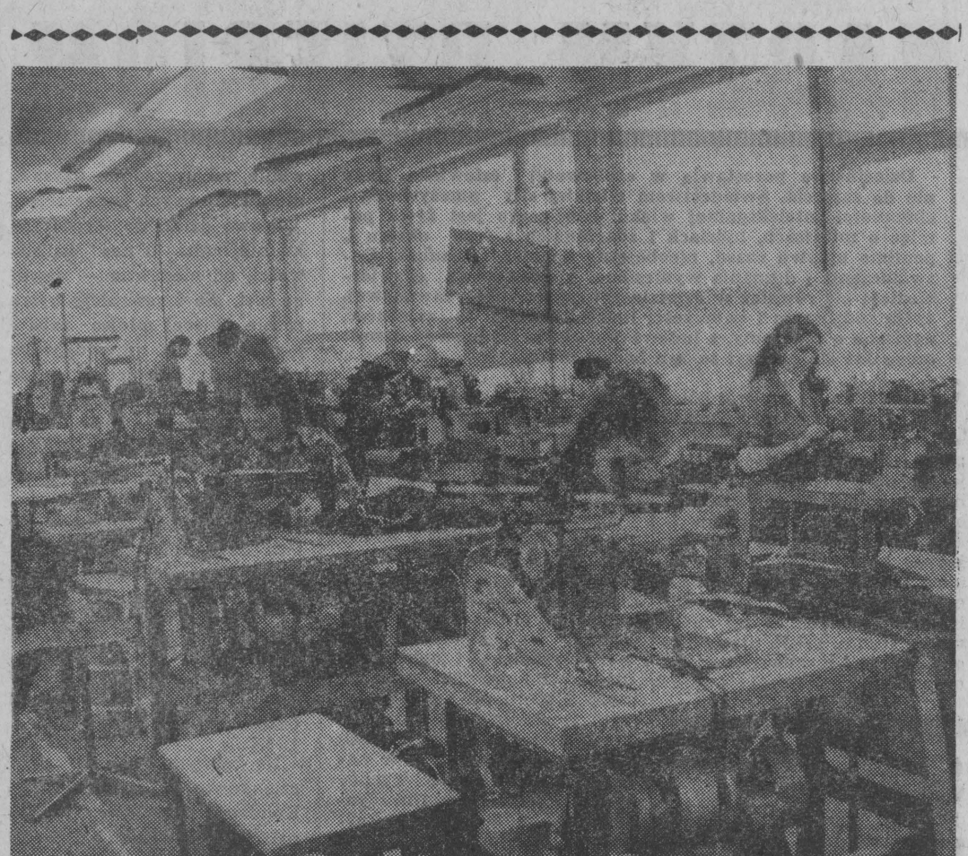
Przez wiele stanowisk musi przejść materiał, zanim powstanie gotowy produkt.