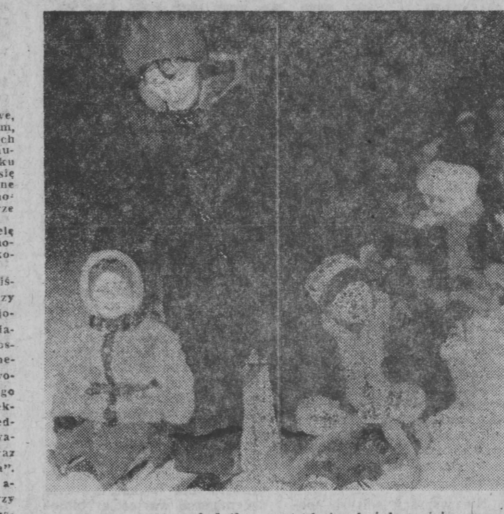
Kulig stanowił dodatkową atrakcję choinkowej imprezy.

Wieloletnie doświadczenia i badania wykazały, że w gospodarstwach domowych i w przedsiębiorstwach, w których pracownicy nie oszczędzają energii elektrycznej, koszty produkcji i usług są znacznie wyższe. Dlatego też, aby zmniejszyć koszty i zwiększyć efektywność pracy, należy stosować energooszczędne urządzenia i metody pracy.