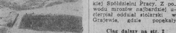
Cląg dalszy na str. 2

Do zakładów nie doszły jeszcze w tym roku żadne