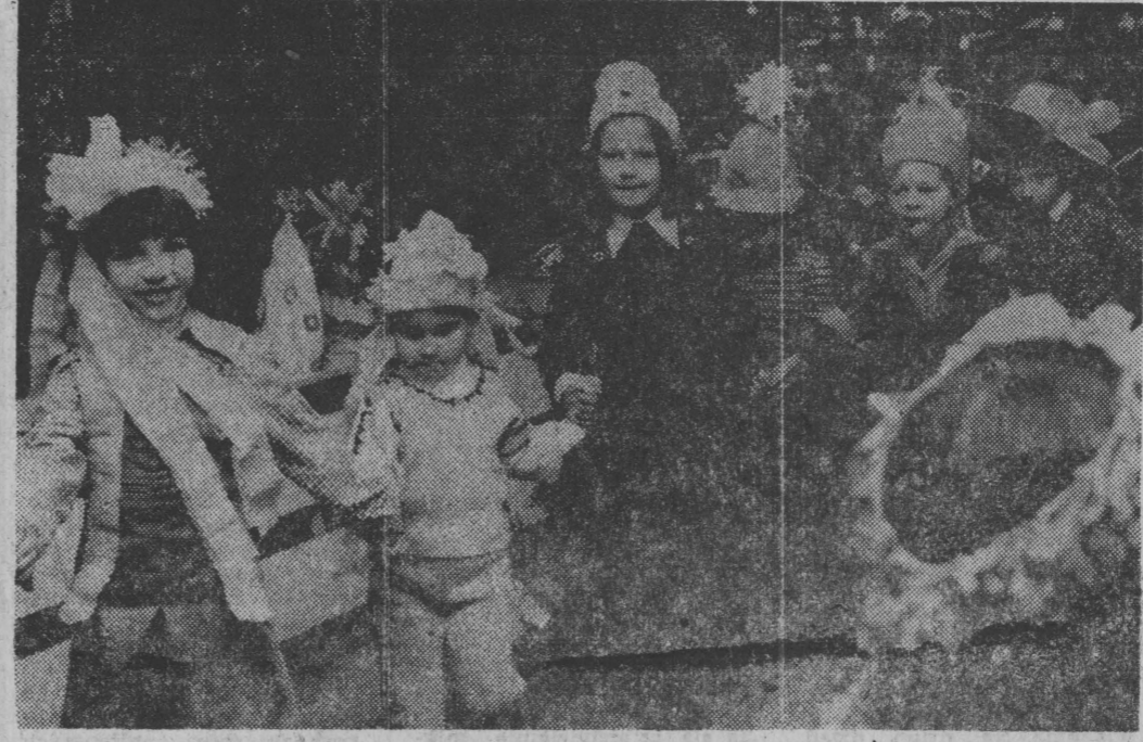
Wesoło bawili się przy choince dzieci handlowców.

Wieloletnie doświadczenia i badania wykazały, że w gospodarstwach domowych i w przedsiębiorstwach, w których pracownicy nie oszczędzają energii elektrycznej, koszty produkcji i usług są znacznie wyższe. Dlatego też, aby zmniejszyć koszty i zwiększyć efektywność pracy, należy stosować energooszczędne urządzenia i metody pracy.