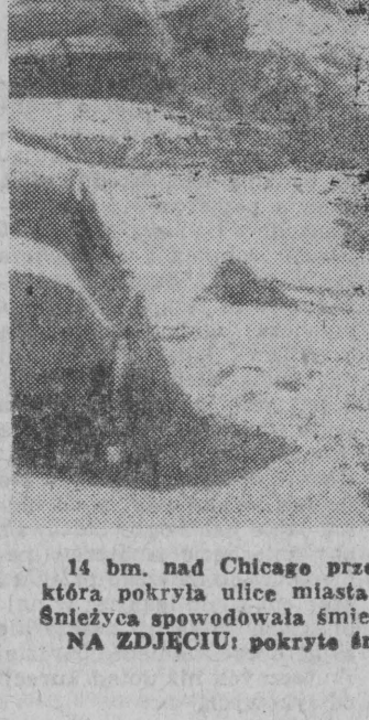
14 bm. nad Chicago przeszła gwałtowna bura śnieżna, która pokryła ulice miasta półmetrową warstwą śniegu. Śnieżnica spowodowała śmierć 7 osób. NA ZDJĘCIU: pokryte śniegiem ulice Chicago.

O'Hare w Chicago (stan Illinois) do zamknięcia go już w sobotę. To najniebezpieczniejsze lotnisko świata było również nieczynne w niedzielę. Tak surowej zimy w tej części Stanów Zjednoczonych nie pamiętano od 1967 roku. Co gorsza, służba meteorologiczna zapowiedziała dalsze śnieżyce w poniedziałek. Huraganowe wiatry utrudniają dodatkowo sytuację i praktycznie udaremniają wszystkie akcje w zakresie odśnieżania. W Kansas i Missouri wkrótce po przejeździe pługów śnieżnych, na drogach tworzyły się nowe zaspę. Znaczna część terytorium USA trzeszczy w okowach silnego mrozu, który obejmuje region od Pueblo w stanie Kolorado po Springfield w Missourii na wschodzie i Austin w Teksasie na zachodzie.