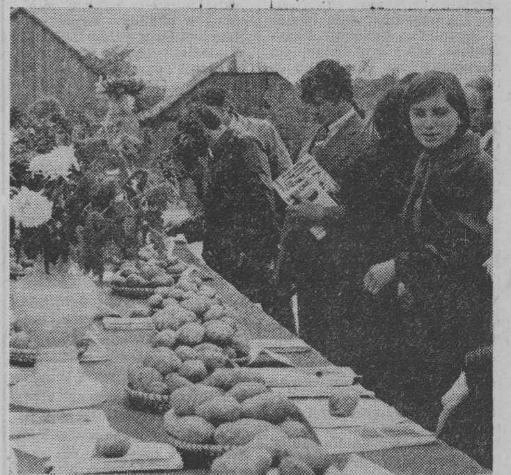
Dużym zainteresowaniem cieszyła się wystawa różnych odmian ziemniaków.

gotowana przez „Agromę”, produktów przemysłu ziemniaczanego, plodów jesieni. Można było też dokonać zakupów na kiermaszu handlowym WZSR. Święto było udane, a co najważniejsze — pożyteczne. (jas)