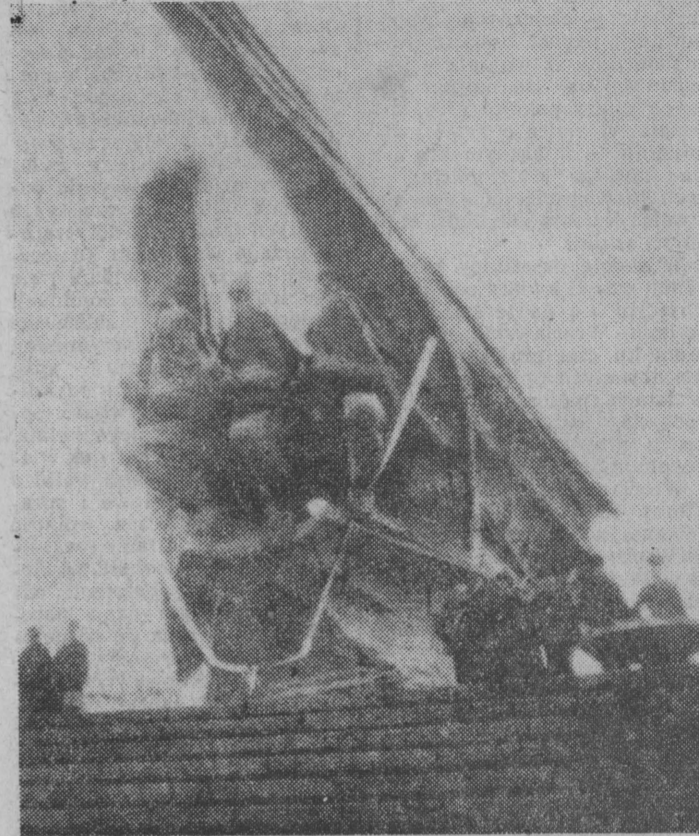
Pomnik Żołnierza Polskiego odsłonięty 6 bm. w Katowicach.

W dniu 11 października 1978 roku o godz. 16.55 Telewizja Polska i Polskie Radio w programach pierwszych przeprowadzą bezpośrednio transmisję z centralnej akademii z okazji 35-lecia Ludowego Wojska Polskiego.