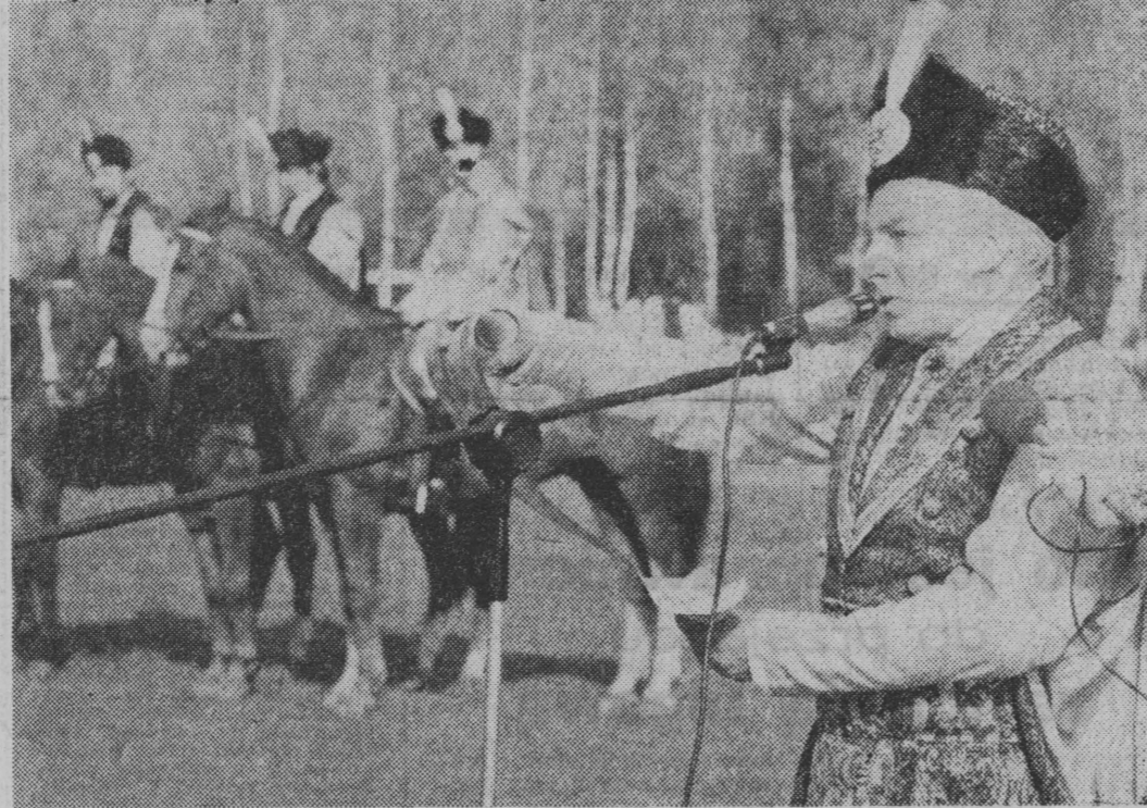
„Wysłannik” Jana III Sobieskiego odczytuje królewską list.