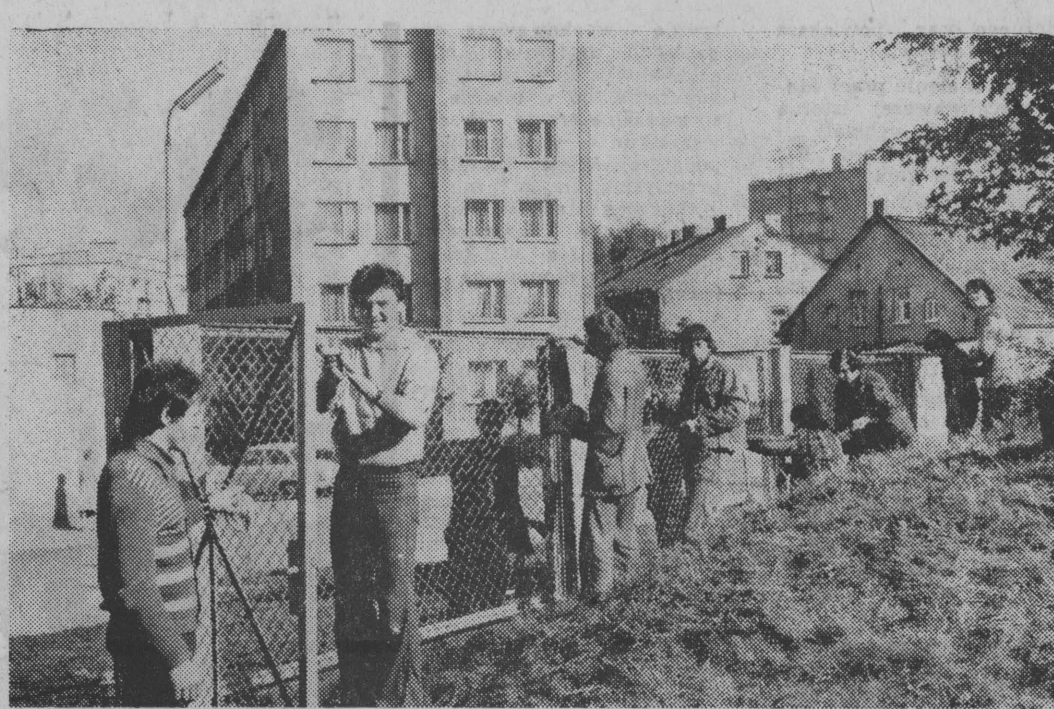
Każdy dobry gospodarz przygotowuje swą posesję na zimę. Uczniowie zespołu Szkół Metalowo-Drzewnych malują ogrodzenie swojej placówki.