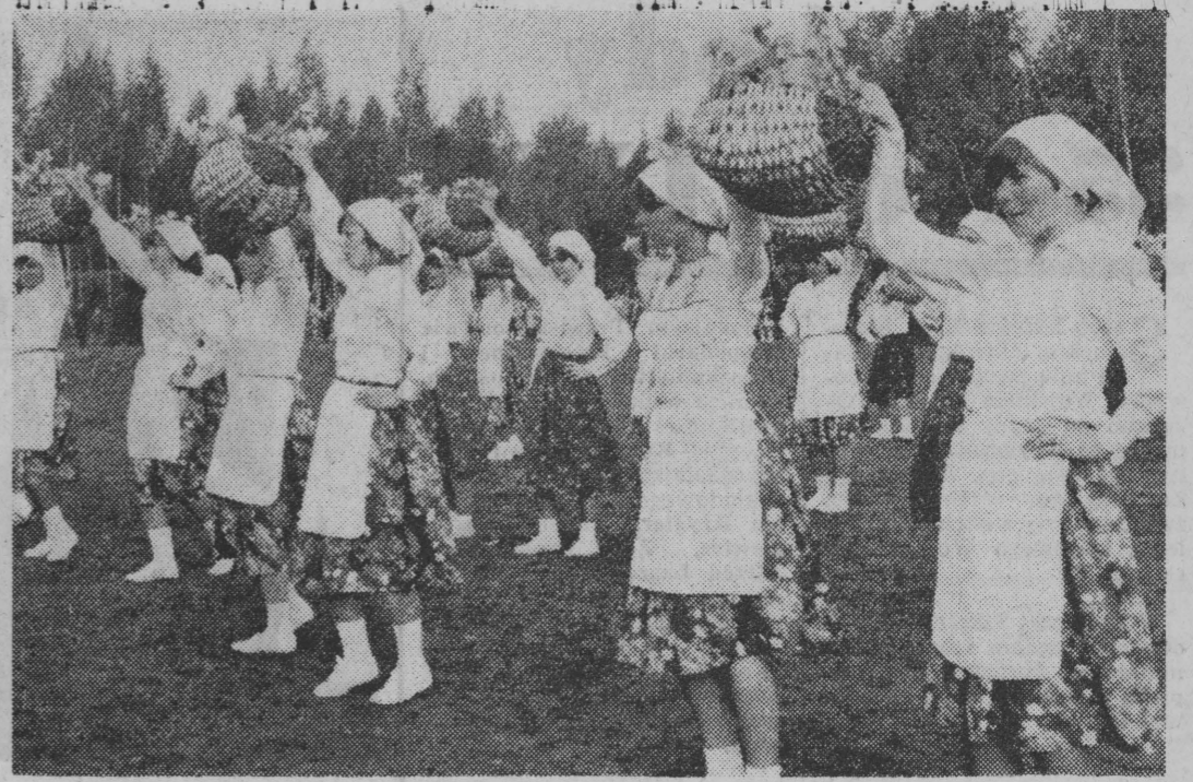
Młodzież odtwarza obrzędy zwłazane z uprawą ziemiaków.