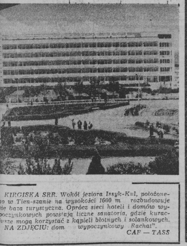
KIRGISKA SRR. Wokół jeziora Issyk-Kul, położonego w Tien-szanie na wysokości 1600 m, rozwija się baza turystyczna. Oprócz sieci hoteli i domów wypoczynkowych powstają liczne sanatoria, gdzie kuracjusze mogą korzystać z kąpieli biologicznych i solankowych. NA ZDJĘCIU: dom wypoczynkowy „Rachal”.

Na podstawie analizy 600 zdjęć systemów gwiazdowych odległych od Ziemi o dziesiątki milionów lat świetlnych astrofizycy z mianego Obserwatorium Biurakowskiego doszli do wniosku, że najmłodsze galaktyki Wszechświata świecą silnym promieniowaniem ultrafioletowym. Zawierają one też często nie jedno „jądro”, lecz dwa. Uczeń sformułował hipotezę, że wszystkie ciała niebieskie powstały z tzw. materii przedgwiazdowej, odznaczającej się nadzwyczaj dużą gęstością. Z niej to — w wyniku wielokrotnych podziałów, które zachodziły w czasie kosmicznych epok — utworzyły się gwiazdy i galaktyki.