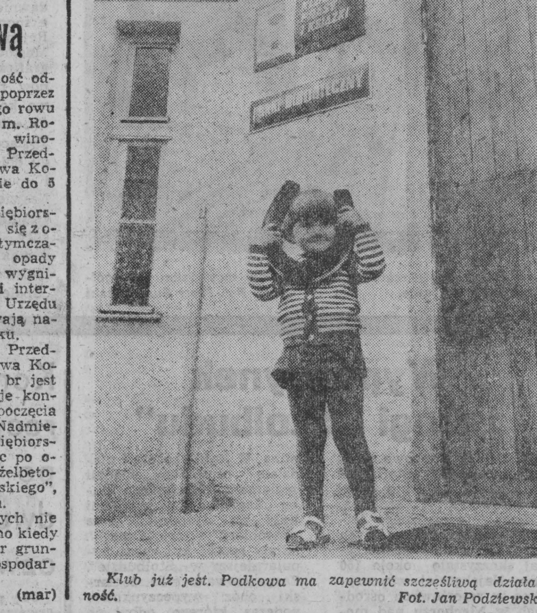
Klub już jest. Podkova ma zapewnić szczęśliwą działalność.