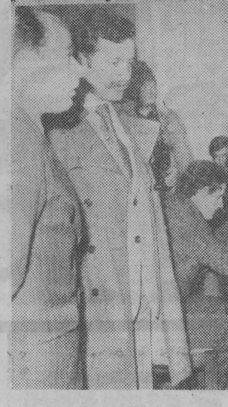
Ekspozycja bielskich kolekcjonerów wzbudziła szczególne zainteresowanie.

BOGATA OPRAWA Inauguracja odbyła się w Bielsku Podlaskim podczas Robotniczego Mityngu Kulturalnego. Mityng ów nazwano festywnym nad festywnymi, gdyż zgromadził przedstawicieli załóg ze wszystkich niemal środowisk robotniczych Białostoczczyzny, które w minionych latach organizowały podobne spotkania i siebie. Zabrakło tylko Białegostoku i Siemiatycz — a szkoda, bo przecież te dwa miasta mają ciekawe doświadczenia i dorobek, jeśli idzie o upowszechnianie kultury wśród załóg robotniczych i powinny — moim zdaniem — stanąć do konkursowych zmagań z takim samym entuzjazmem, jak to uczyniły: Bielsk Podlaski, Hajnówka, Sokółka, Czarna Białostocka i Łapy.