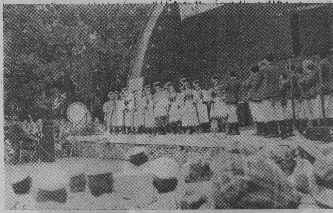
Podczas mityngu w Bielsku Podlaskim wystąpiło wiele interesujących zespołów artystycznych.