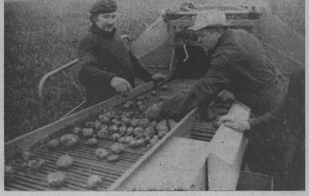
Zbiór ziemniaków kombajnem w gminie Mońki. Tu wykopki zbliżają się do półmetka.

* Wkrótce koniec żniw * Czas rozpocząć parowanie ziemniaków * Gromadzenie pasz — ważne zadanie rolnictwa