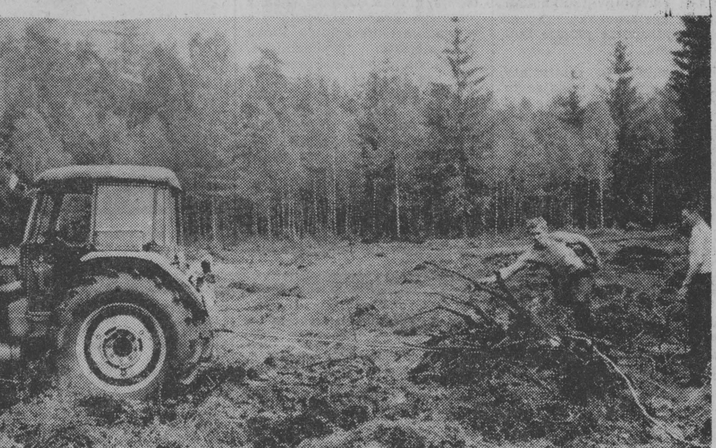
Każdy sposób na usuwanie korzeni jest dobry. Ciągnik wypożyczony z SKR pracę tę znacznie ułatwił. Trzeba tylko dobrze zamocować liny.