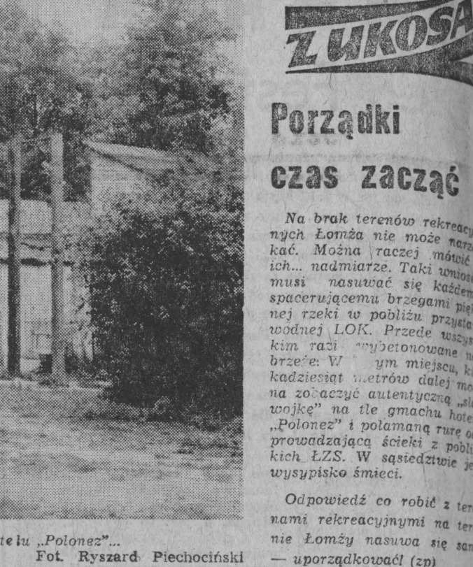
NA ZDJĘCIU: „na ile hotelu „Polonez”...