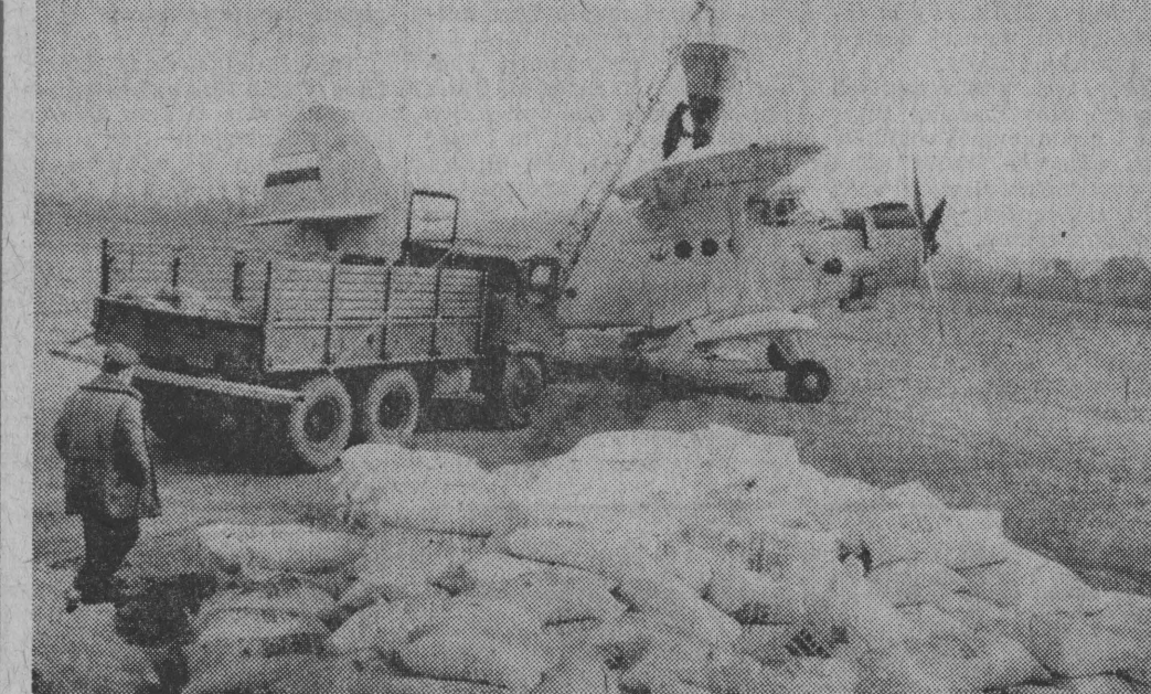
Urodzaj spada z... nieba na pola węgorskich PGR-ów za sprawą kętrzyńskiego Agrolotu.