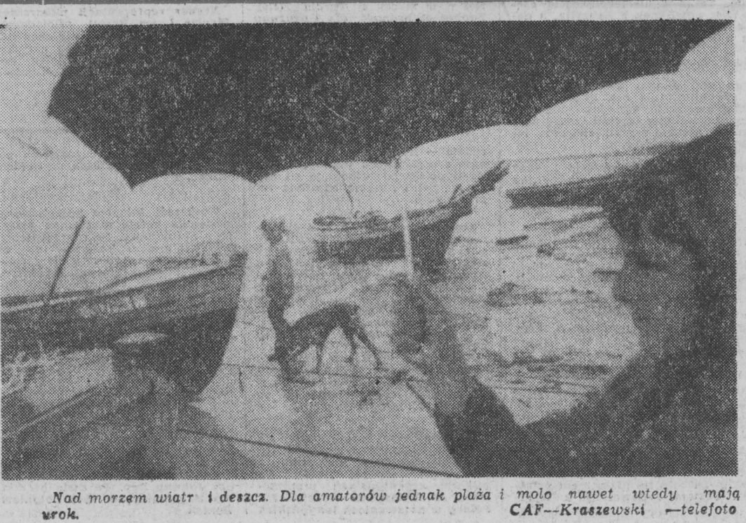
Nad morzem wiatr i deszcz. Dla amatorów jednak plaża i molo nawet wtedy mają wrok.

Sejsmologzy — pisze prasa — przewidują możliwość nowych, jeszcze silniejszych wstrząsów podziemnych w rejonie prefektury Miagi.