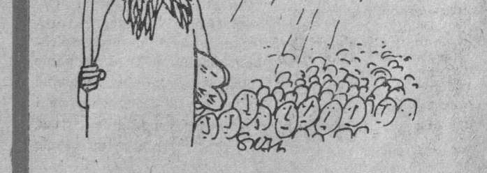
Miała być manna, ale kooperanci... Rys. S. K...

Nie da się ukryć — jeszcze jeden rok minął.