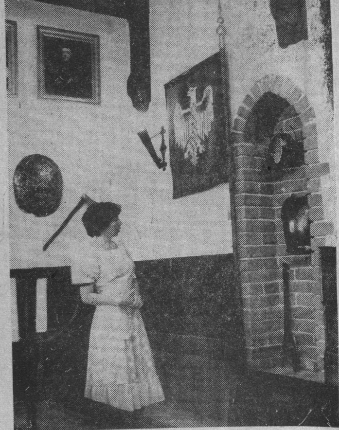
Rozrasta się Muzeum Wojska. NA ZDJĘCIU: otwarta w 1977 r. Sala Rycerska.