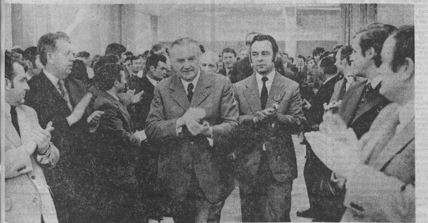
Serdecznymi oklaskami powitała załoga przybyłego na akademię prezesa Rady Ministrów — PIOTRA JAROSZEWICZA.

Jak poinformował prezes Rady Ministrów wojewoda — Jerzy Zientara w województwie notuje się wyższe niż średnio w kraju tempo wzrostu produkcji materialnej i usług, co jest wynikiem wysokiej wydajności pracy załóg robotniczych i znacznego postępu w polnictwie. Świadectwem tego są dobre wyniki w skupie mleka i zbóż,