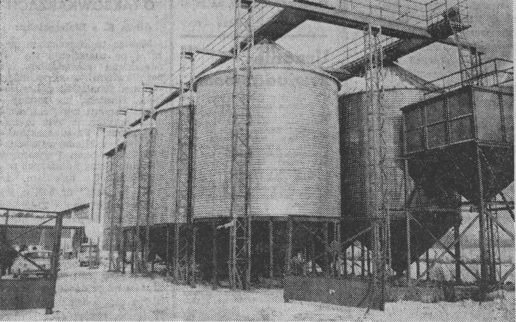
Nowa mieszalnia pasz w PGR Pierkunowo.

Pogłowie zwierząt właściwie utrzymało się na poziomie sprzed dwóch lat, a pola nawet w trudnych dla rolnictwa latach nie o-brodziły gorzej niż w roku 1974. Nie znaczy to, że dochody rolników utrzymały się na takim samym poziomie. Nawet podobne spożycie na nowe wybudowane domy, zwie-