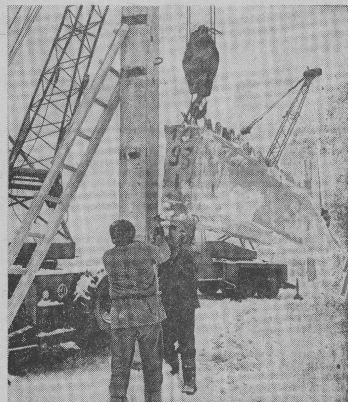
Warunki zimowe nie pomagają w pracach montażowych.