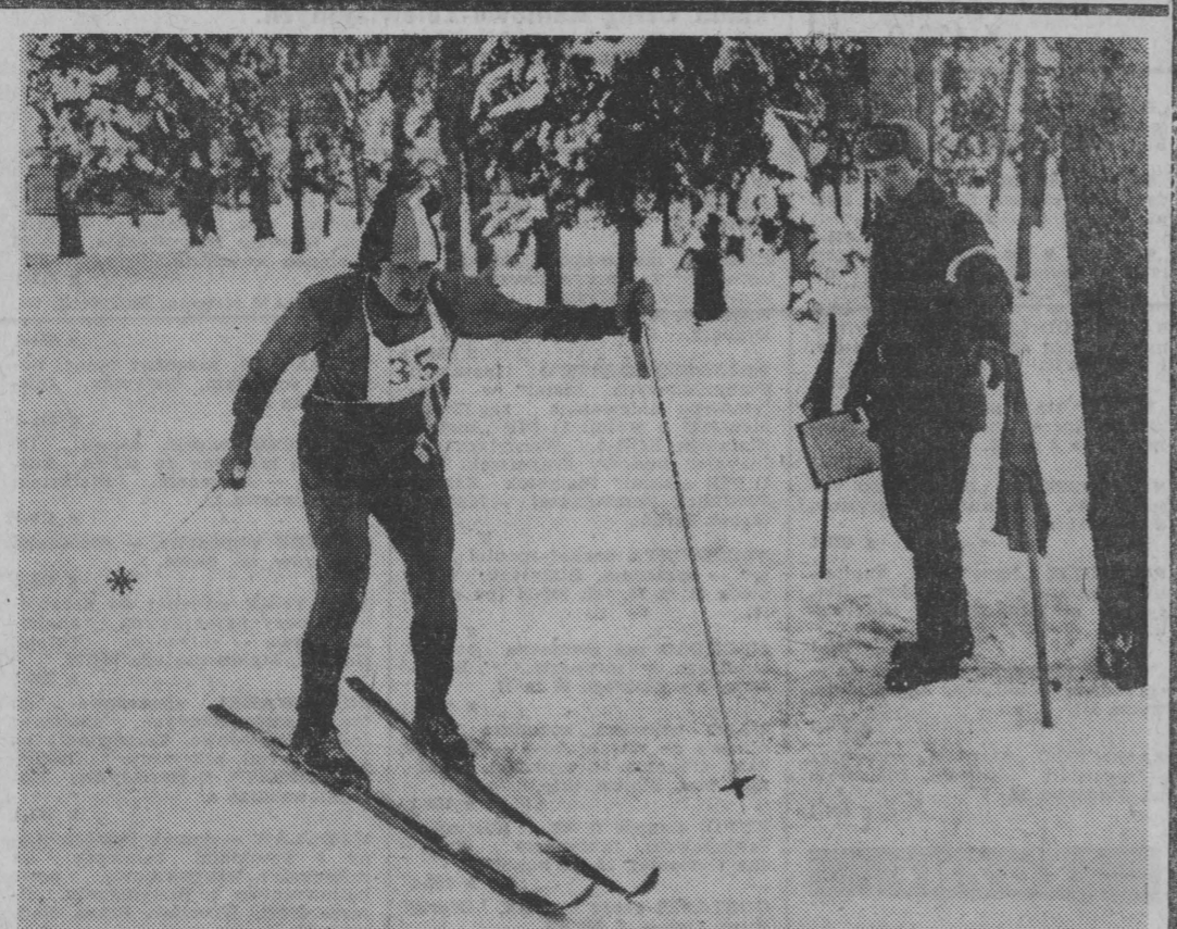
Na narciarskich trasach w Supraślu odbywają się I Zimowe Akademickie Mistrzostwa w sportach obrotowych. W pigłnej zimowej scenarii startują reprezentanci 9 okręgów, wyłonieni z wcześniejszych eliminacji międzyuczelnianych. (ko) NA ZDJĘCIU: na trasie biathlonu mężczyzn.

Członkostwo jednego z 34 zarejestrowanych kół (funkcjonuje 26) wobec ich małej kilkusetosobowej liczebności zapewnia dodatkową zaprogramowaną wiedzę, dostęp do prac eksperymentalnych, współpracę z pracownikami