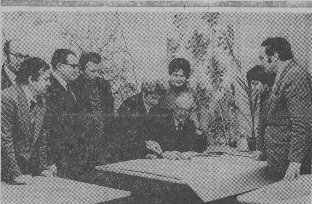
Grupa pracowników białostockiego Biura Planowania Przestrzennego (laureaci nagrody Ministra Administracji Gospodarki Terenowej i Ochrony Środowiska „za wybitne osiągnięcia twórcze w przestrzennym kształtowaniu miast i wsi, ochronie środowiska oraz w rozwoju techniki”). Jedną z siedmiu równorzędnych nagród otrzymał 10-osobowy zespół z BIURA PLANOWANIA PRZESTRZENNEGO W BIAŁYMSTOKU.