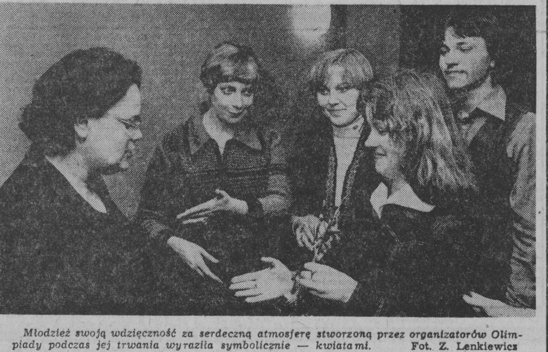
Młodzież swoją wdzięczność za serdeczną atmosferę stworzoną przez organizatorów Olimpiady podczas jej trwania wyraziła symbolicznie — kwiatami.