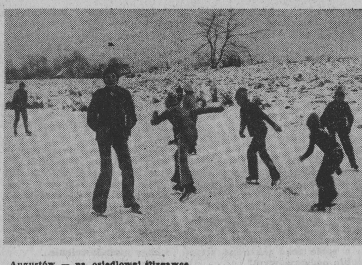
Augustów — na osiedlowej śluzawce.

Groźny pożar powstał w samodzielnym wozachakach naprawczych SKR w Rynie (woj. suwalski) Składowiska. (m)