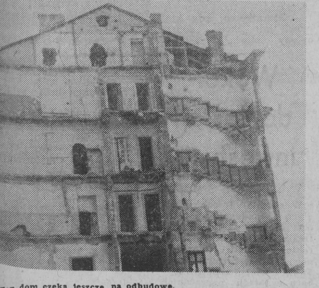
Ten dom czeka jeszcze na odbudowę.