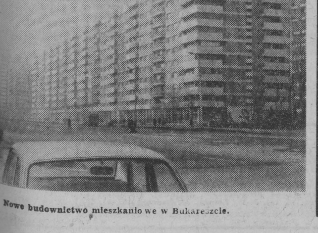
Nowe budownictwo mieszkaniowe w Bukareszcie.

— Planowane zadania ubiegłego roku wykonaliśmy w ciągu 11 miesięcy. Zamięliśmy go kwotą prawie 30 mln złotych. Jest to poważny wzrost. Realizacja tych planów wymagała wielu wysiłków i operatywności, ambitnego zaangażowania całej załogi. Trzeba wziąć pod uwagę, że przedsiębiorstwo istnieje dopiero drugi rok. Obsłużyliśmy 286 wycieczek, które przyjechały do nas. Skupiły one prawie 10 tys. osób. Natomiast w turystyce wyjazdowej zorganizowaliśmy 118 wycieczek z udziałem prawie 8 tys. osób.