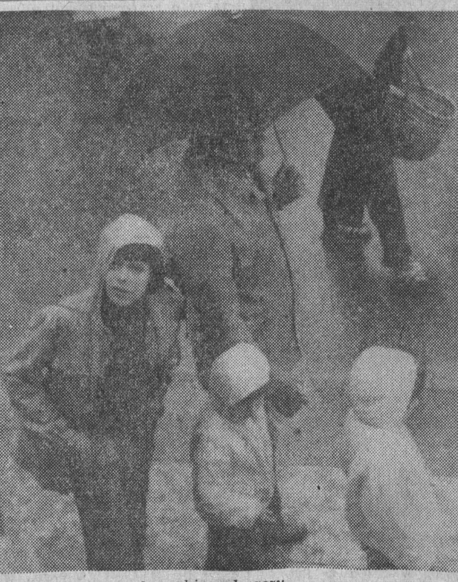
Sierpień też pod znakiem deszczu.