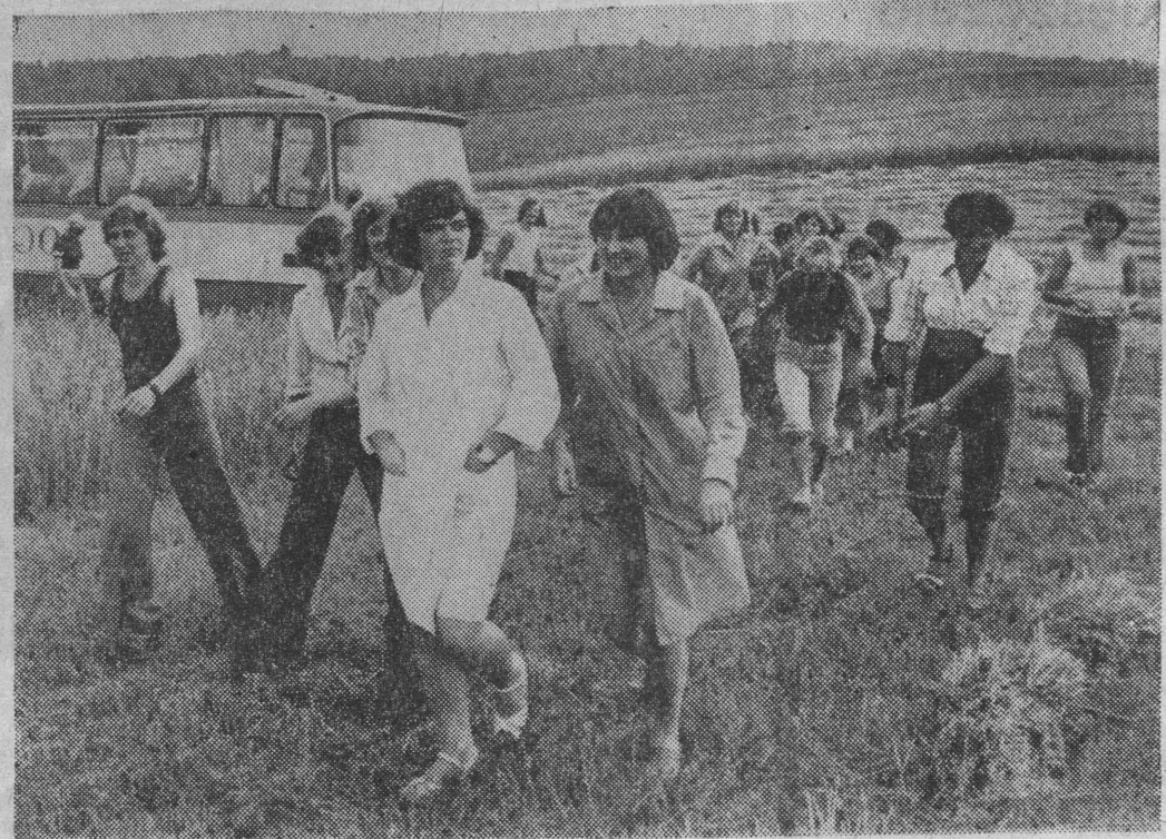
Zakładowy autokar przywiózł 62 27-osobową grupę.