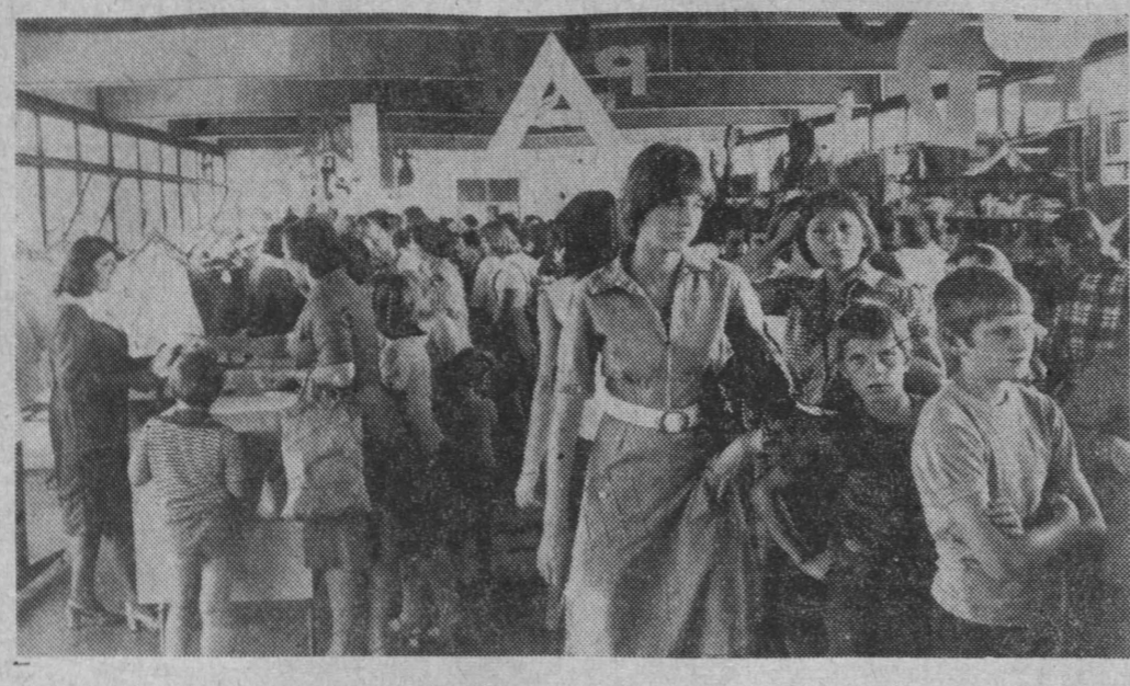
W stoiskach z dziewiarstwem i konfekcją panował największy ruch.

— Przewodniczący... — Marczus wleżał jeszcze z trudem oddycha, głos mu się zalamuje.