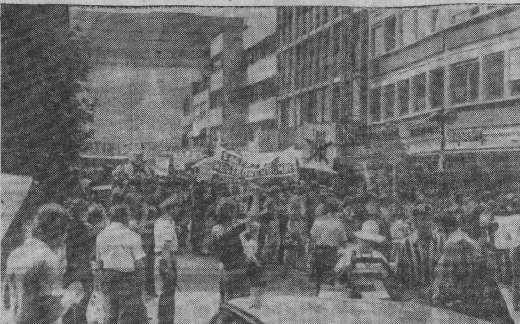
W wielu krajach odbywają się demonstracje mieszkańców domagających się poniesienia planów produkcji bomby neutronowej. NA ZDJĘCIU: demonstracja przeciwników neutronowej bomby zorganizowana w Bonn (RFN).