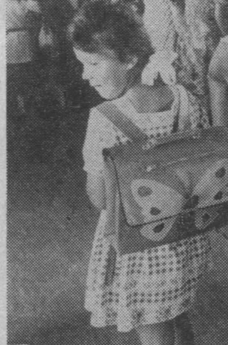
Taki ładny tornister chętnie się kupuje i chętnie się nosi.

Obecnie co siódmy białostoczanin mieszka w lokalu należącym do BSM. Oczekującej jest jednak nadal wielu. Dla tych mamy dobrą wiadomość. W ubiegłym 5-leciu na osiedlach: „Tysiąclecie”, „Centrum”, „Sienkiewicza” i „Przyjaźń” oddano do użytku 2,5 tys. mieszkań; natomiast w latach 1976-80 przybędzie ich dwukrotnie więcej. Dodajmy — coraz większy i o lepszym standardzie.