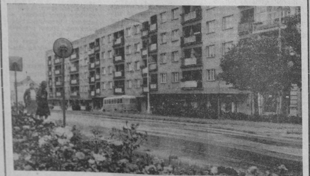
Ulica Armii Czerwonej w Elku, przygotowana „na wysoki poziom” będzie dobrą wizytówką przedfestynowych dokonań elczan.

ków szermierczych, występów zespołów folklorystycznych, ognisk harcerskie, zabawy ludowe. Nie sposób wymienić wszystkich, co proponują uczestnikom festynu jego organizatorzy.