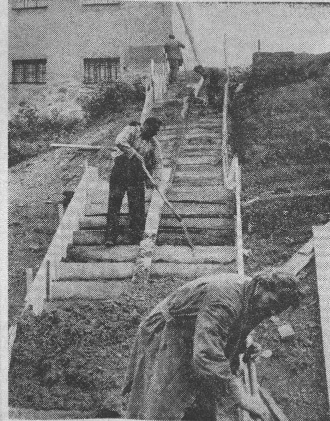
Pracownicy elckiego oddziału Przedsiębiorstwa Budownictwa Komunalnego w Suwałkach postanowili dołożyć swą cegiełkę do festynowych czynów i przystąpili do budowy schodów, prowadzących na skarpę nad brzegiem jeziora Elk.