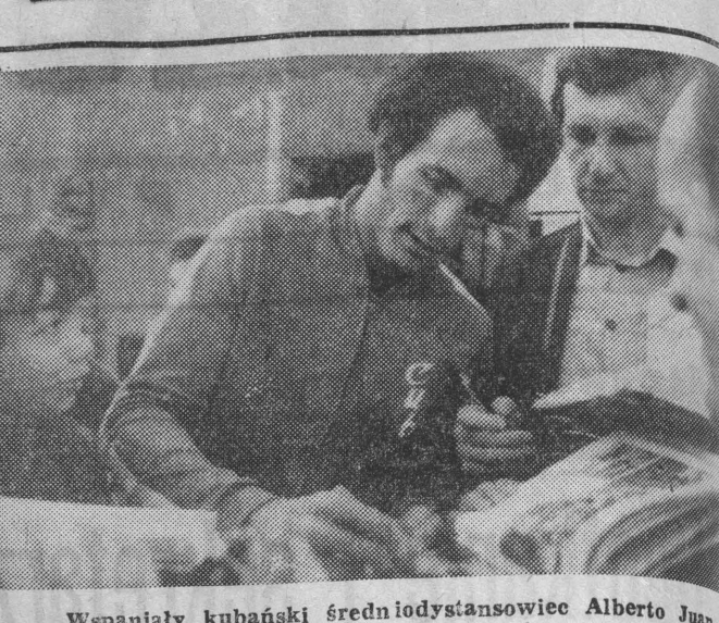
Wspaniały kubański średniostansowiec Alberto Juantorena wszędzie obiegany jest przez łowców autografów.