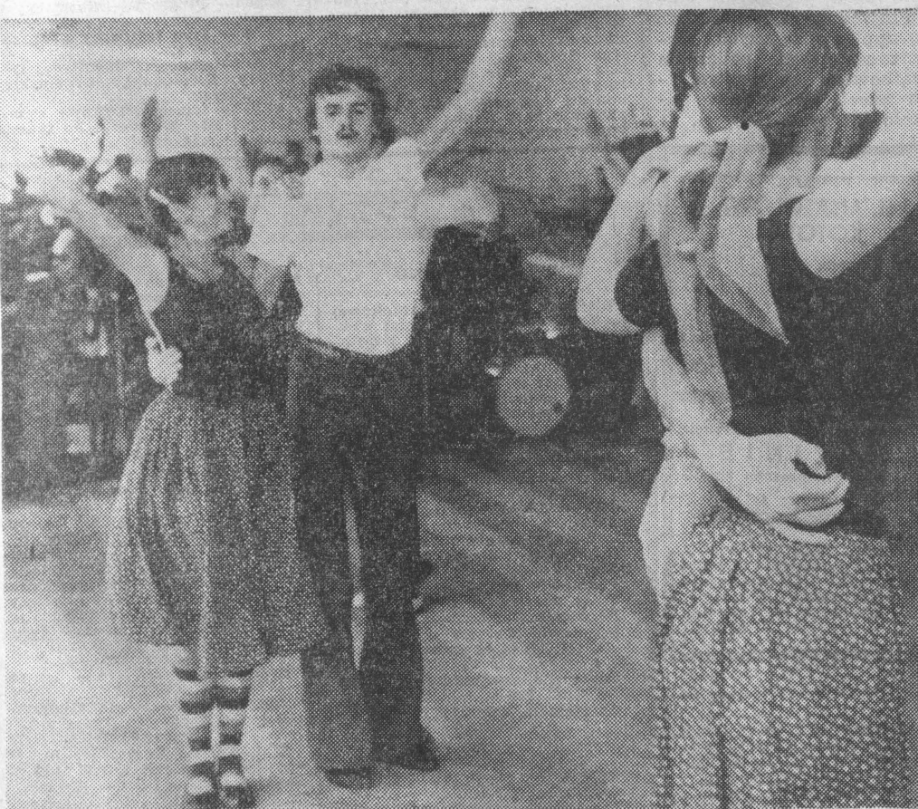
Zespół „Polonez” z Chicago podczas próby „Suiity Kurpiowskiej”.

W tym roku Związek Radziecki zmienił się nie do poznania gospodarka narodowa. Niepodzielnie panuje własność socjalistyczna. Została ona, w ujęciu Konstytucji, rozszerzona o własność związków zawodowych i innych organizacji społecznych. Jest to rozwinięcie 1 artykułu Konstytucji stwierdzającego, że „Własność socjalistyczna jest podstawą gospodarki państwa”.