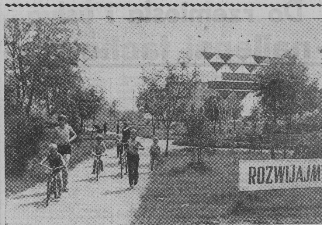
POM w Smolinkach tonie w zieleni i... „Szyrenkach”. Wie lu pracowników dojeżdża do pracy własnymi samochodami. Gdzie dobrze pracują, tam dobrze placą...