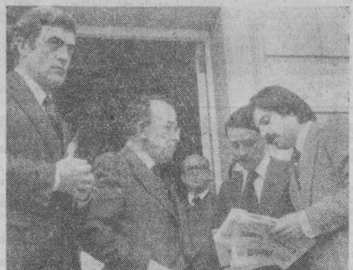
Sekretarz generalny Komunistycznej Partii Hiszpanii Santiago Carrillo został 22 bm. przyjęty przez Premiera Hiszpanii Adolfo Suarez. Było to pierwsze od 40 lat spotkanie przywódcy komunistów z szefem rządu. NA ZDJĘCIU: S. Carrillo w rozmowie z dziennikarzem po spotkaniu.