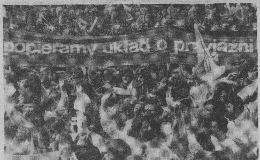
popieramy układ o przyjaźni

Równie rzeczowa, konkretna i krytyczna jak informacja premiera, była dyskusja poselska, która rozwinęła się nad sprawozdaniem rządu. W debacie tej Sejm — najwyższy organ kontroli społecznej w systemie socjalistycznego ludowładztwa — wnikliwie ocenił działalność rządu w pierwszych miesiącach tego roku, decydującego o powodzeniu manewru ekonomicznego, którego założenia wytyczył Komitet Centralny PZPR na swych V i VI posiedzeniach plenarnych, manewru — jak podkreślano — trudnego, ale niezbędnego dla urzeczywistnienia nadrzędnych celów społecznych. Generalne wnioski z tej dyskusji, w której zabrali głos członkowie wszystkich klubów i kół poselskich można sformułować do następujących ocen: tegoroczne zadania społeczno-gospodarcze wykonywane są na ogół pomyślnie, a przedsięwzięcia rządu podjęte dla operatywnego przezwyciężenia szeregu napiecia i słabości zaczynają przynosić rezultaty. Obecnie szybszy postęp w efektywności gospodarowania