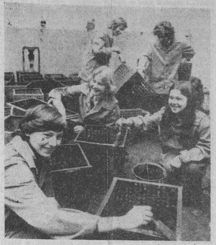
W ramach trwającej od 20 bm. „Wiosny Czynów” młodzież zrzeszona w organizacjach ZSMP, ZHP, SZSP, wykonuje szereg prac porządkowych na rzecz ochrony środowiska naturalnego i miejsca zamieszkania, bierze udział w czynach produkcyjnych.

Według pierwszego oficjalnego bilansu ofiar katastrofy, śmierć poniosło 569 osób, w tym wszyscy pasażerowie i członkowie załogi „Boeinga 747” holenderskich linii lotniczych KLM. 80 osób przeżyło katastrofę, ale stan wielu z nich jest bardzo ciężki.