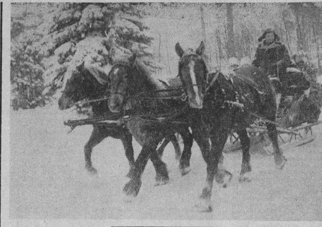
To zdjęcie dedykujemy organizatorom sobotnio-niedzielnego wypożyczenia ludzi pracy. Pamiętajcie, że wszelkiego rodzaju zabawy na śniegu i kuligi są najatrakcyjniejszą formą spędzania wolnego czasu o tej porze roku.

„Czy tak ma wyglądać tort?” — z tym pytaniem