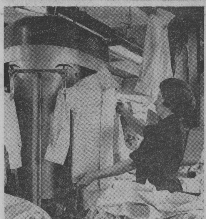
Milion koszuł rocznie szyje się w Robotniczej Spółdzielni Pracy im. J. Dąbrowskiego w Krakowie. Aby jeszcze więcej produkować na rynek postanowiono zmodernizować (stanowiła ona już czynione) cały park maszynowy. Część prac kierownictwo spółdzielni chce rozdzielić między chałupników w Krakowie jak i na terenie województwa tarnobrodzkiego oraz nowosądeckiego.