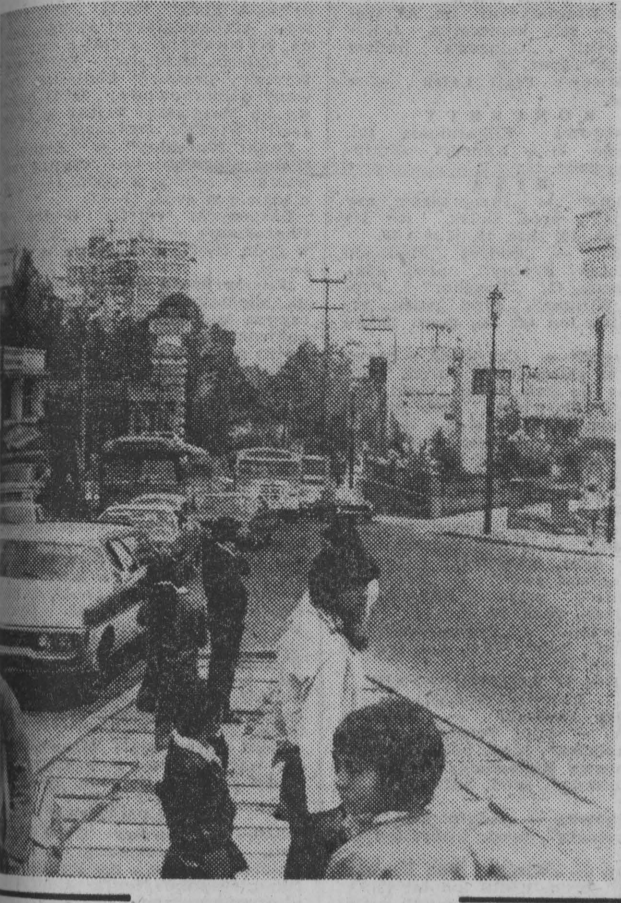
Centrum Madrytu