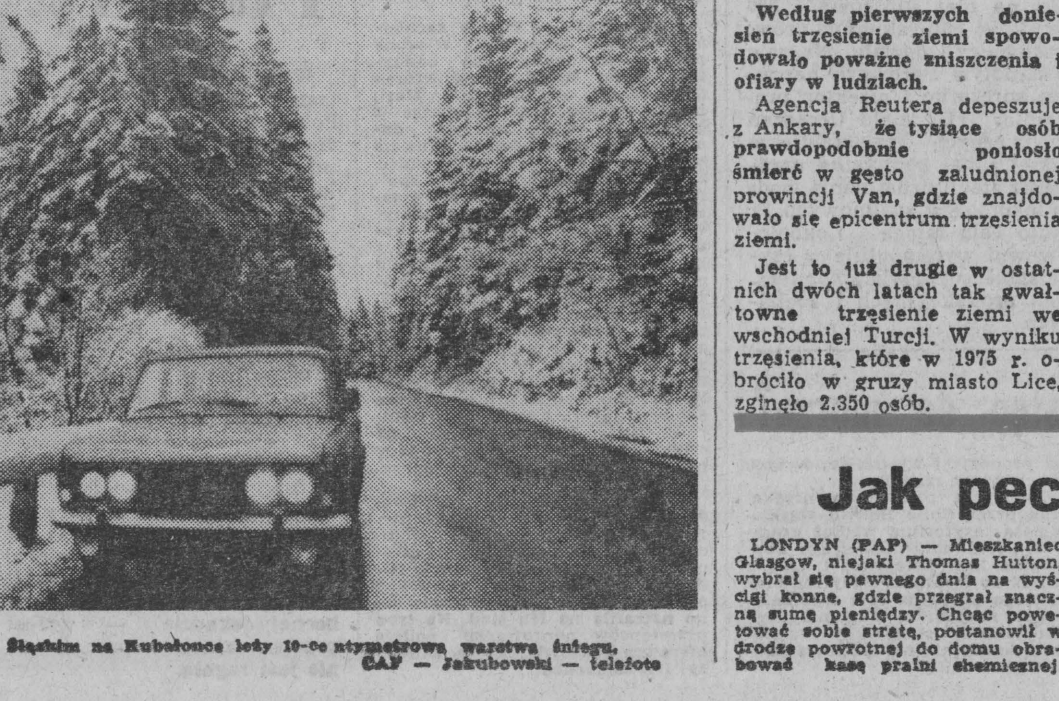
W górach już śnieg. W Beskidzie Śląskim na Kubalonie 10-go listopada warstwa śniegu.