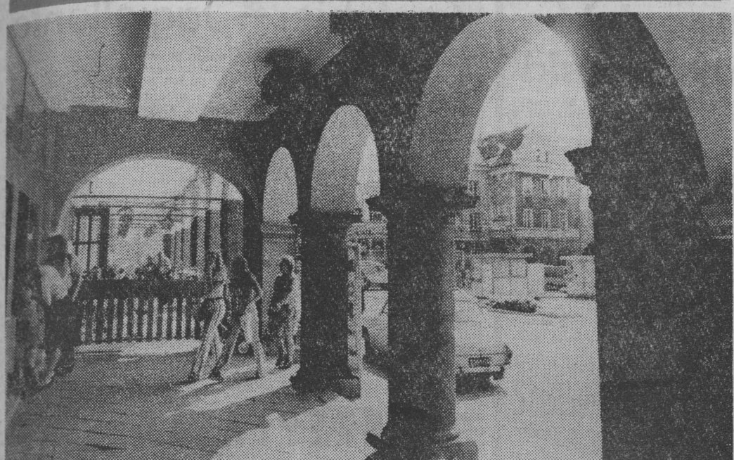
Nie ma wycieczki czy też tury, który zwiedzając województwo olsztyńskie nie zajrzy tutaj. Piękny jest stary Olsztyn i bogata ma historię, która pozostawiła wiele cennych zabytków i pamiątek.

ALGIER (PAP) — W Etiopii przeprowadzana jest obecnie reforma terenowych organów władzy w miastach. Jak głosi decyzja tymczasowego rządu wojskowego, całą władzę w miastach przekazuje się zromantyzowanym mieszkańcom. Nowe rewolucyjne organa władzy — stwierdza dalej dokument — są masowymi organizacjami ludu pracującego. Ich zadaniem jest przyczynianie się do aktywności i bezpośredniego uczestnictwa ludu pracującego w politycznym i gospodarczym życiu kraju.