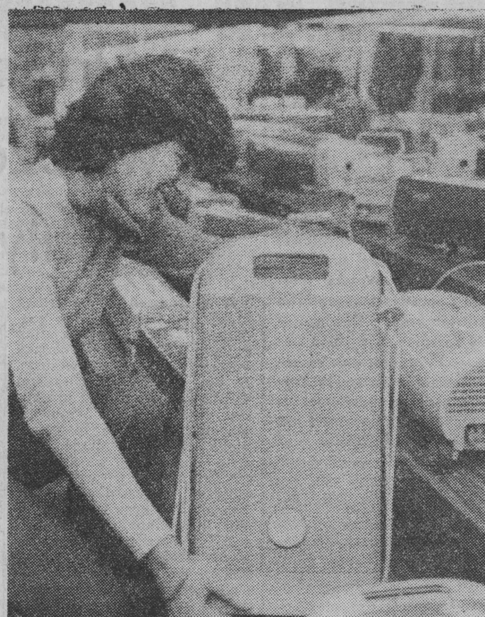
ciąg dalszy na str. 2