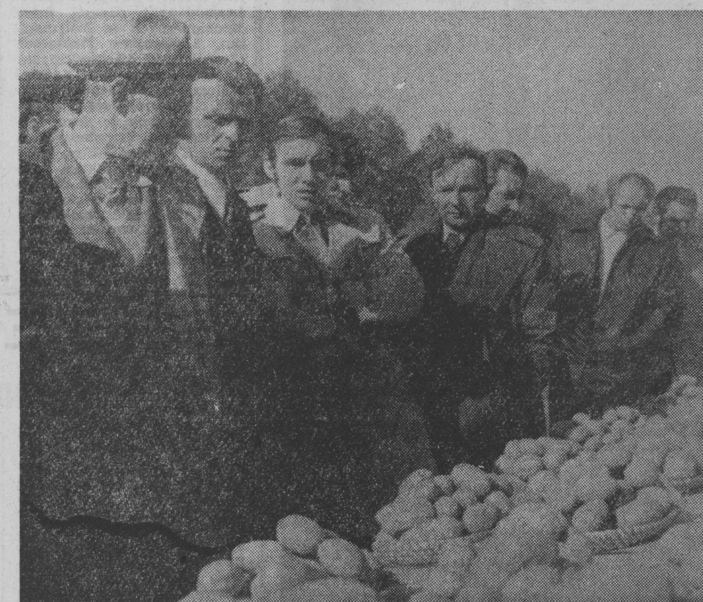
Na Święto Ziemniaka — wystwa tca najdородniejszych odmian, uprawianych w gminie.

licznych imprez, które złożyły się — w przeddzień zakończenia wykopków — na regionalne ŚWIĘTO ZIEMNIACKA.