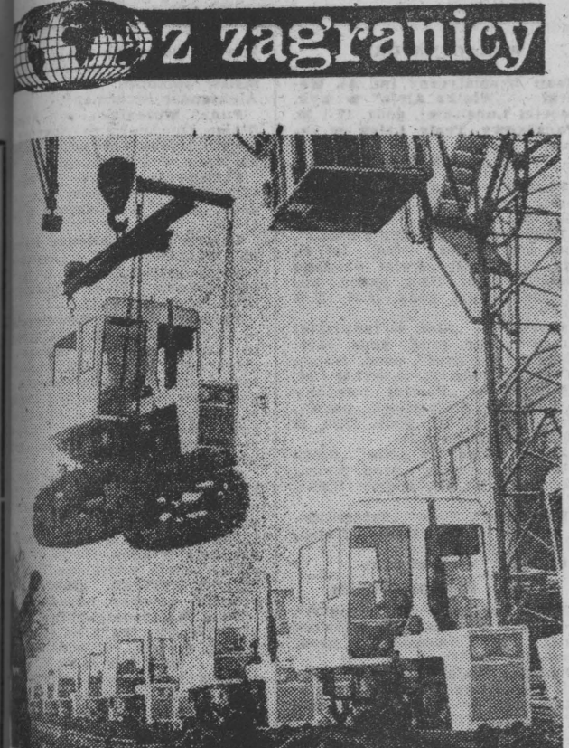
Z zagranicy ZSRR. Fabryka traktorów w Międzywodziu (Moldawska SRR) produkuje swoje własne traktory. Na zdjęciu: czarna linia montażowa i pracownicy przy montażu traktorów.