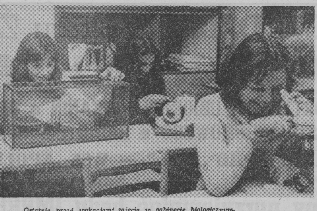
Ostatnie przed wakacjami zajęcia w gabinecie biologicznym.

Z obrad VIII Krajowego Zjazdu WSK w Białymstoku. O polsko-radzieckich wycieczkach przyjaźni...