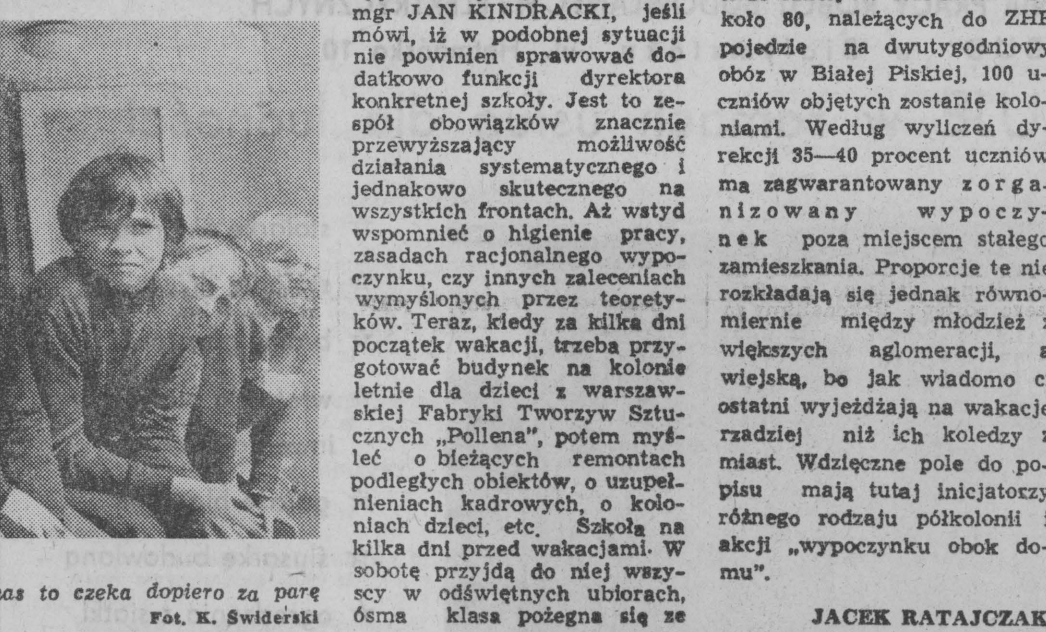
Ośmioklasisci odchodzą, a nas to czeka dopiero za parę lat.

Równie wstrzemięźliwie biegna ósmoklasistom wspominki na temat, jak im było w szkole przed minione lata. Jeszcze za krótki dystans, jeszcze pamięć nazbyt świeża, jeszcze się nie zatęskniło do kogoś, czegoś nie przypomniało inaczeln. Musi na ów czas opackić mgła zacierająca kontury spraw przykrych, uwydat-