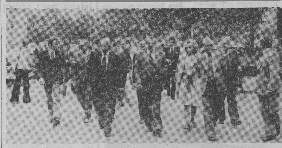
Goście przed głównym wejściem do PSK.