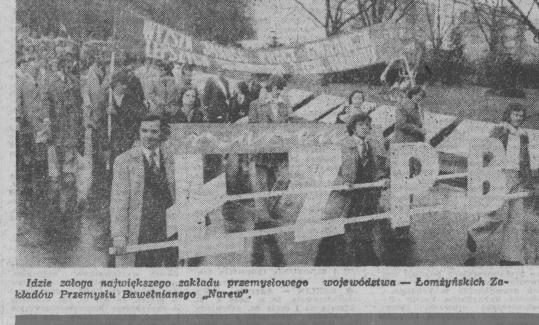
Idzie zolga największego zakładu przemysłowego województwa — Łomżyńskich Zakładów Przemysłu Bawełnianego „Narew”.