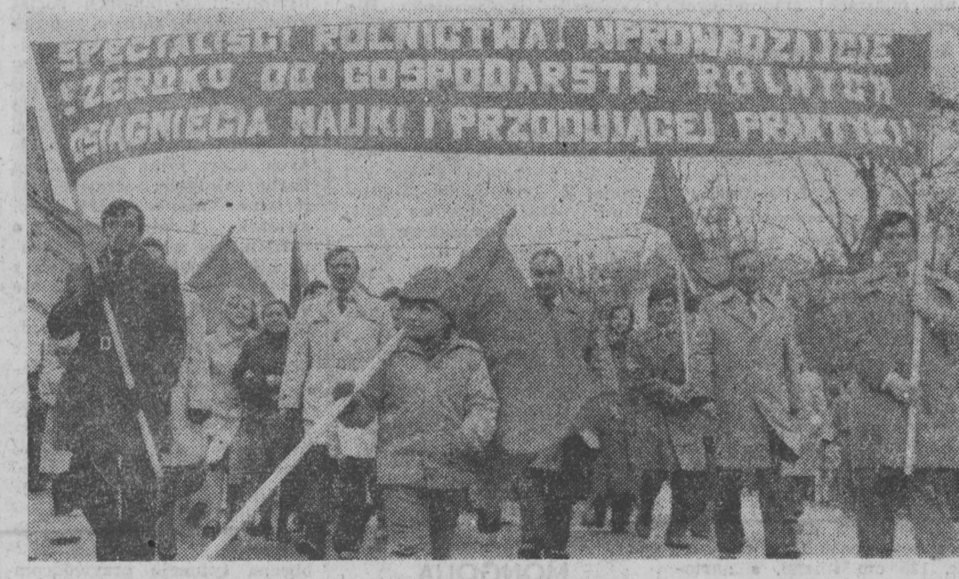
W manifestacji pierwszomajowej w Suwałkach uczestniczyła liczna grupa pracowników Państwowych Gospodarstw Rolnych.

W Białymstoku trasa manifestacji przebiegała — tradycyjnie już — szeroko i przestronnie. Aleja 1 Maja. Nie dopisała wprawdzie pogoda — było chłodno, a tuż przed godz. 10 spadł rzęsy, majowy deszcz, lecz gdy pochód ruszał zza chmur wyłoniło się słońce. Na czele pochodu orkiestra białostockiego Oddziału WOP. Za partiami sztabowymi partii i stronnictw politycznych, organizacji młodzieżowych i społecznych, wśród przedstawicieli różnych środowisk zawodowych Białostoczyzny, weteranów ruchu robotniczego, przedowników pracy, aktywistów partyjnych i młodzieży — idą gospodarze województwa. Pozdrawiani serdecznymi okłaskami zajmują miejsca