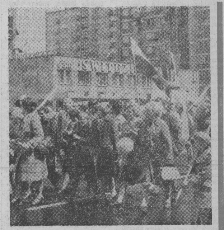
W radosnym nastroju mieszkańcy Białegostoku na trasie 1-majowego pochodu.