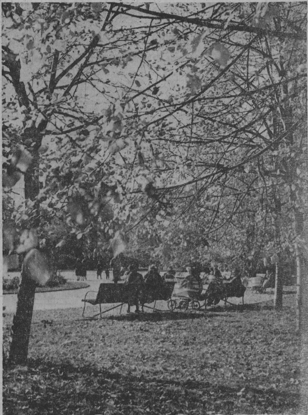
W październikowy dzień.

LONDYN (PAP) — Szef państwa południowego Wietnamu Phan Khac Suu powierzył misję utworzenia nowego rządu burmistrzowi Saigona, Tran Van Huongowi.