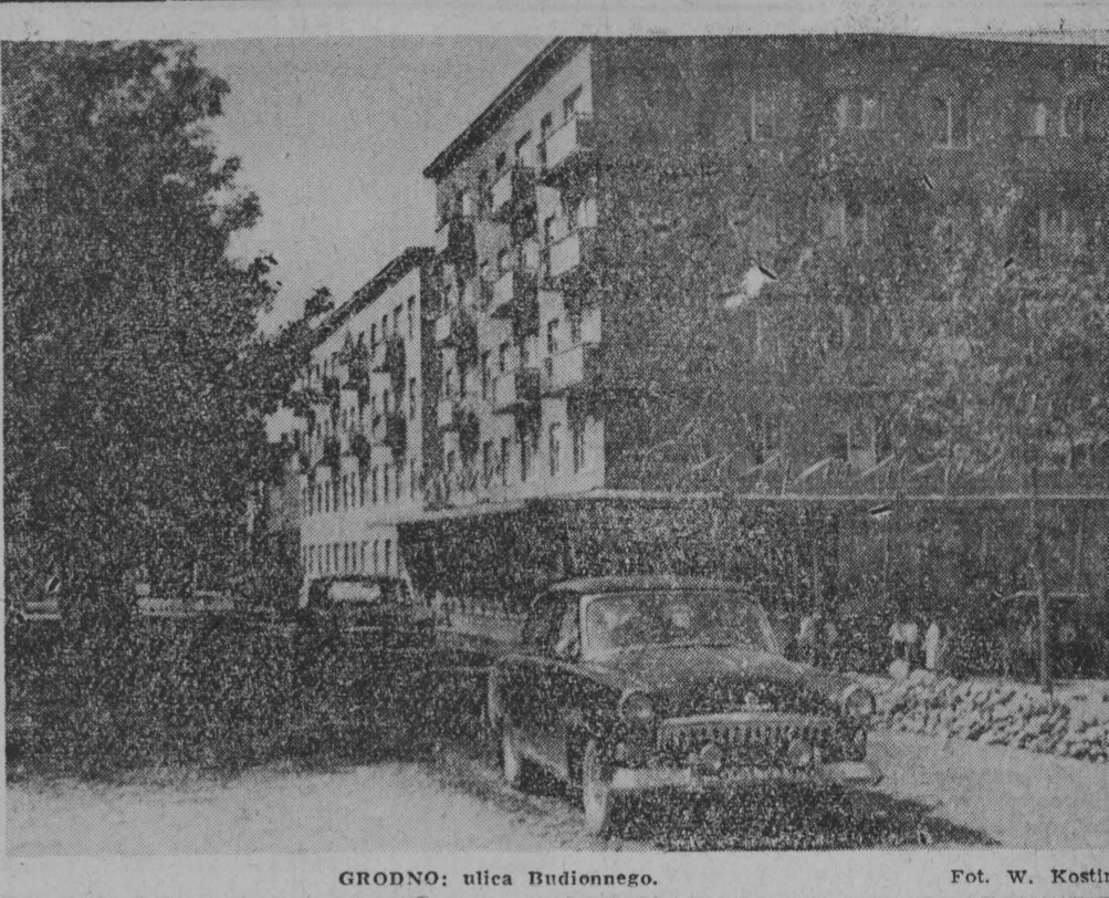
GRODNO: ulica Budionnego.