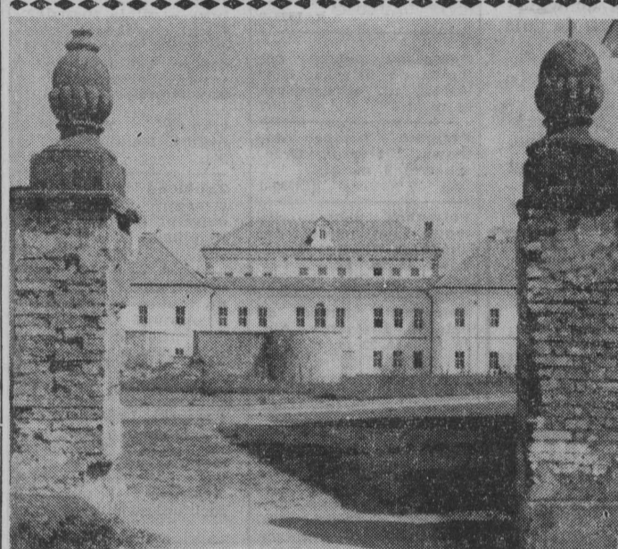
Supraśl — Technikum Rolnicze.

Na apel odpowiedziały już zarządy powiatowe TPP-R w Olecku i Białymstoku. (a)