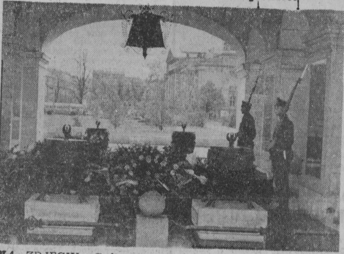
NA ZDJĘCIU: Grób Nieznanego Żołnierza na Placu Zwycięstwa w Warszawie.