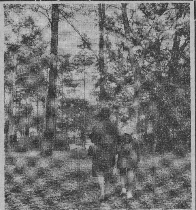
Jesienny spacer w parku.

Jutrzejszy „czwartek prawniczy” ma na celu zapoznanie z problematyką przestępstwa nieletnich oraz odpowiedzialności rodziców. Początek o godz. 18. Wstęp — jak zwykle — wolny. (h)