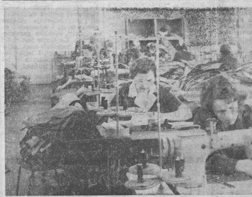
Fragment taśmy produkcyjnej.