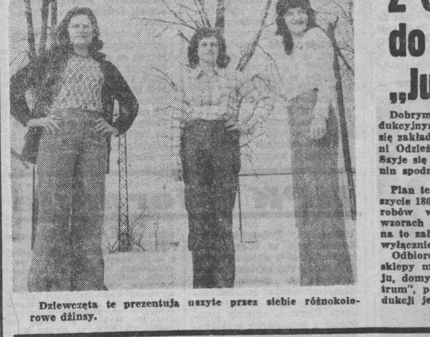
Dziewczyna te prezentują uszyte przez siebie różnokolorowe dzinsy.