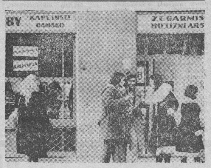
Czy w tym miejscu na przykład nie powinna być jakaś przystępna kawiarenka.

Jeśli placówki handlowe, to nie w klasycznych kłitkach, jak to ma obecnie miejsce, z dwóch czy trzech wąskich pomieszczeń trudno urządzić jedno obszerne i oferujące atrakcyjniejszy towar. Typu pamiętającego, cepelowskiego czy — jeśli to byłoby możliwe — salonu w rodzaju warszawskiej „Natuszy”. I koniecznie powinny się tu znaleźć niewielkie zakłady gastronomiczne szybkiej obsługi lub też kawiarenki z ogródkami. Wówczas popularny białostocki deptak stałby się rzeczywiście