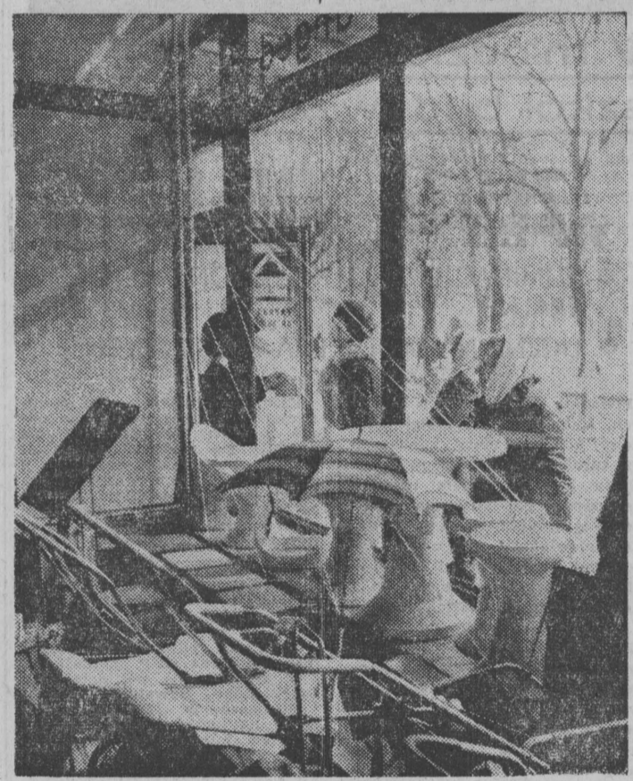
Pierwsi klienci nowego sklepu — to panie.

Rezultaty tego są już widoczne. Prawie wszystkie ziemienniki zostały zmrożone. Obecnie ZPZ w Łomży przystąpiły do wywożenia ziemienników. Nietrudno obliczyć poniesione straty. Kto za to zapłaci? Czyżby niegospodarność w kalkulowano w koszty handlowe? (alg)