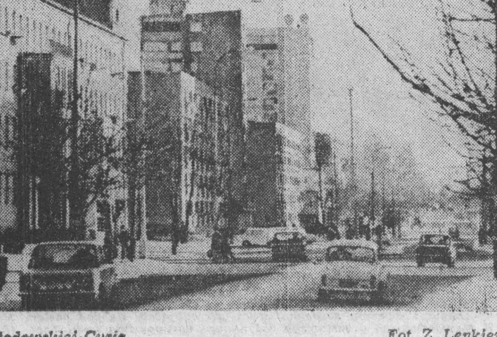
Białystok - ul. Marii Skłodowskiej-Curie

Pożar hotelu w USA WASHINGTON (PAP) - W niedziele spłonął hotel w amerykańskiej miejscowości wycoznaczony Duluth (stan Minnesota). 3 osoby doznały rannych, wśród ofiar znalazły się trzy dzieci właściciela hotelu.