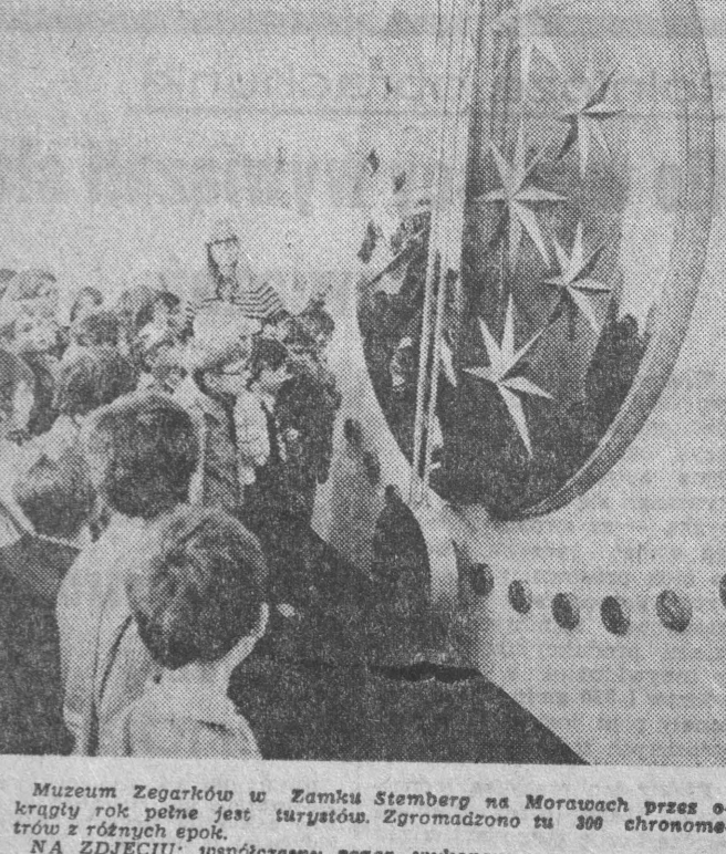
Muzeum Żegarków w Zamku Stenberg na Morawach przez ok. pięćdziesiąt lat jest turystów. Zgromadziło tu 300 ochotników z różnych epok. NA ZDJĘCIU: uspołeczniony egzar, wykonany przez artystę F. Belchacka i ujęty na topografie.

LUANDA — Dziennik „Diário da Luanda” pisze, że w ostatnim momencie południowej wojny Ludowej Republiki Angoli wzięli do niewoli nową grupę żołnierzy regularnej armii Republiki Południowej Afryki. W niedzielę wieczorem został przetrzymany w południowej części Angoli, w miejscowości Balfast. Powodem było wykrycie na miejscu 10-300 (numer kodu pocztowego), Białostok, ul. Wesołowskiego 1, z dopiskiem na kopercie „Plebiscyt sportowy”. Ostateczny termin wylosowania kuponów miało być 6 stycznia przyszłego roku. Zauważamy, że honorujemy jedynie kupony oryginalne — wydane „GW”. Jak każdego roku między trybun Cytelników, których typy okazały się zgodne z ostateczną kolejnością.