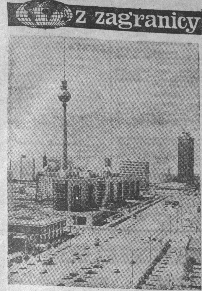
Berlin - stolica NRD.