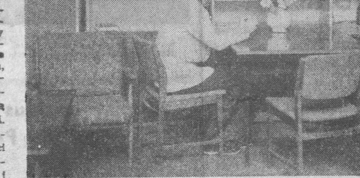
Fabryka Mebli w Łasku jest słynnym producentem szklanych siedzisk typu „Asch” i „Nowa Łódź”. Od początku 1976 roku zakład wytwarzać będzie smędy/łokowane meble tych segmentów — bardziej funkcjonalne i dające więcej możliwości różnorodnego zastosowania. Dla uczczenia VII Zjazdu partii szopka fabryki podjęła się dodatkową produkcję wartości i mln. 600 tys. szt. Szklana ta tylniokana w terminie. Do końca 1975 roku fabryka dostarczy jeszcze dodatkowo meble szklane w ilości 600 tys. sztuk. NA ZDJĘCIU: meble szklane typu „Asch”.

Szeroką gamę nowości, i to nie w minimalnych seriach, zapowiada także przemysł lekki. Aż 40 proc. całej produkcji mają stanowić wyroby nowe, nowoczesne i zmodernizowane. Zapowiedź miła brzmiała dla każdego ucha, tym bardziej, że pomoc wyrobów unowocześnień i zmodernizowanych nie zawsze będą pretendowały do cen nowości. Takowe rezerwy się wyłącza. Nie da przewidzieć nowości — tak przynajmniej zapowiadają kierownicy zjednoczeń i resortu. Otrzymały więc nowe rodzaje i odmiany tkanin bawełnianych, wełnianych i jedwabnych. Ich nowość będzie polegała na zmianach surowcowych — przez zastosowanie odpowiednich mieszanek podnoszą się walory użytkowe tych materiałów, będą lekcie, miękkie i przyjemne w uchwycie, łatwe w konserwacji. A więc zestaw szaleńców pokazy. Sama tylko branka bawełniana przygotowuje i dostarcza do sklepów ok. 70 mln m nowych jakościowo, wzorniczo i kolorystycznie tkanin. Będą więc nowe rodzaje drukowanych tkanin na bieliznę pościelową, 8 mln m nowych tkanin koszulowych, 25 mln m płaszczowych itp. Na płaszczyźnie przemysł włókienniczy przygotowuje nowe odmiany lodenów łączonych z mohaiem, damskie tweedy, dzianiny tkaninopodobne, bistor z wełną i ałanę. W dzwierzawic oczekiwamy większej liczby bluzek i sweterków w