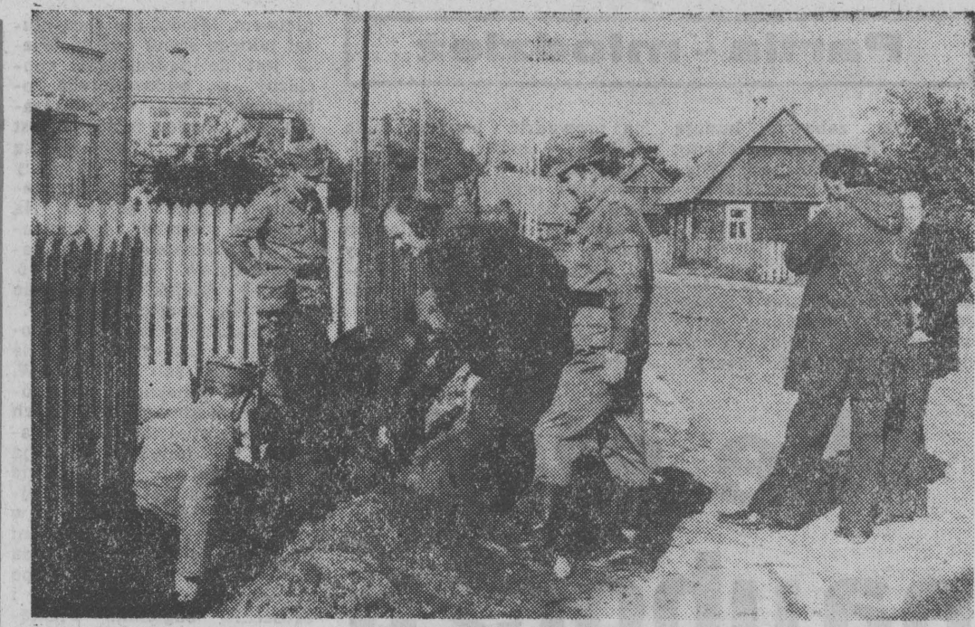
NA ZDJĘCIU: prace ziemne przy układaniu kabla telefonicznego na ul. Grodzkiej w Knyszynie.