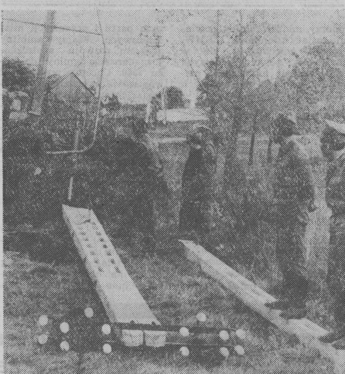
NA ZDJĘCIU: żołnierze i łącznościowcy przy ustawianiu stupa „blizniaka” w okolicy Jasionówki.

Rolnik z miasta — niedługo zasiedlił mieszczuch takie określenie używa za obraźliwe. Mieszkańcy Kolna nie mają takich uprzedzeń. Tu, rolniczymi decyzjami kieruje. W mieście istnieje 496 gospodarstw, które uprawiają 2,5 tys. ha. Rolnicy rolnicy hodują 418 sztuk bydła i ok. 3 tys. sztuk trzody chlewnej. (zp)