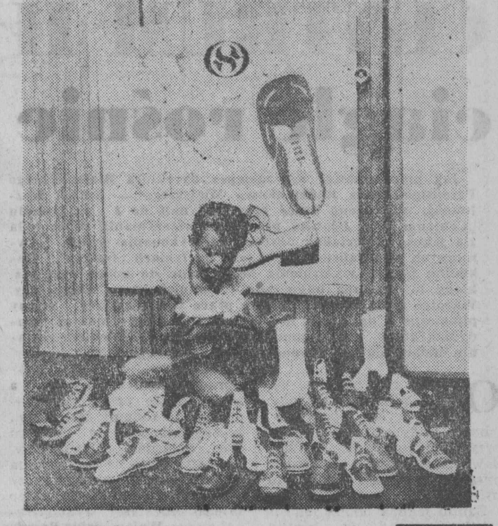
Ponad trzy miliony par butów dziecięcych i miodziejących dostarczą w tym roku Zakłady Obuwia w Skarżysku Kamiennym.

Pielęgniarki wiejskie są w olbrzymiej większości zadowolone ze swej pracy i swego zawodu - taki wniosek przynosią wyniki przeprowadzonych ostatnio wśród nich badań.