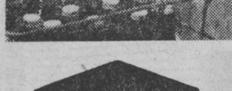
Ważną rolę w przemyśle suwalskim odegrała także jedna z kolei - jak wiadomo - jedno spóźnienie pociąga za sobą dezerwację jazdy. Na czym ciurmy także my, pasażerowie. (ib)