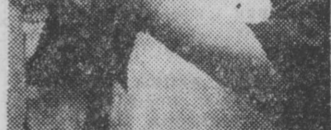
Kierownik - Dionizy Stankiewicz - w przyszłej piecarni spodziewa się budowy nowych wygodniejszych pomieszczeń.