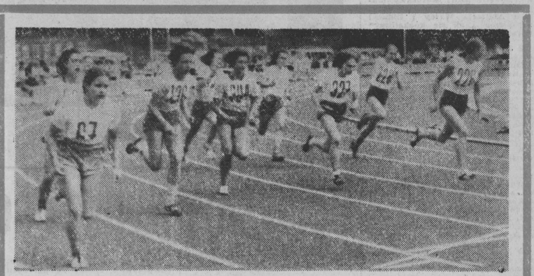
Na zwierzyńckim stadionie w Białymstoku królują od wczoraj lekkoatletyka. NA ZDJĘCIU: przedbieg sztafety 4x100 m dziewcząt.

PARYZ — W środę rano w Atenach doszło do gwałtownych starć między strajkującymi robotnikami budowlanymi i policją, w wyniku których ponad 30 osób zostało rannych. Starcia wywołały też klęskę policji, która nie dotarła do demonstracji około 4 tys. robotników na głównych ulicach miasta. Robotnicy domagają się poprawy warunków pracy.