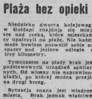
Rys. B. Jaroszewicz

Zakład, uruchomiony w 1952 roku, zatrudnia dziś około 200 osób. Nie jest on najnowocześniejszym, i praca nie jest tu lekka. Opracowano więc plany modernizacji urządzeń. Przede wszystkim zmechanizuje się skład surowca, co pozwoli na wyeliminowanie najcięższych robót, zwiększe-