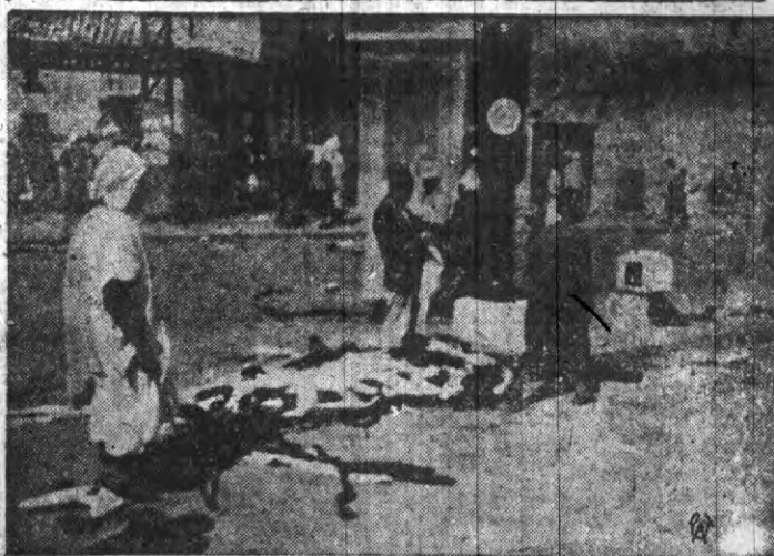
KRWAWE ROZRUCHY W ALGERZE

Jeden z placów w Constantine w Algierze po ostatniej masakrze żydów. Na środku leży olbrzymie jaszczka zwłoki ofiar morderstwa.