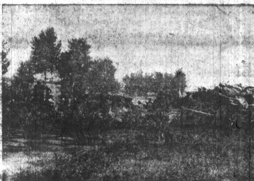
Ratowanie dobytku nieszczęśliwych powodziar w woj. krakowskim.