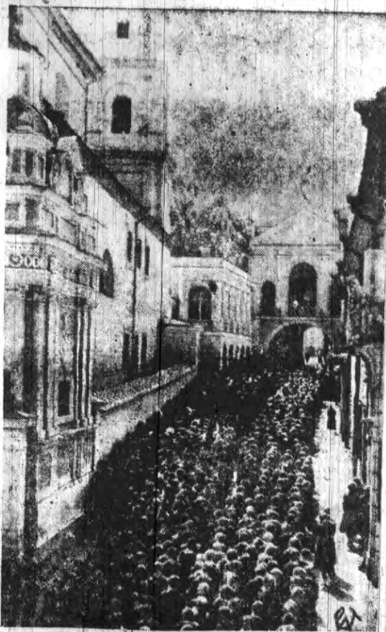
WILNE ZJAZD ZWIĄZKU HARCERSTWA POLSKIEGO W WILNIE W Wilnie odbył się w obecności p. min. W. R. i O. P. Wacława Jedrzejewicza XIV wabny zjazd Związku Harcerstwa Polskiego. Zdjęcie przedstawia uczestników zjazdu, na nabożeństwie przed obrazem Matki Boskiej Ostobramskiej.