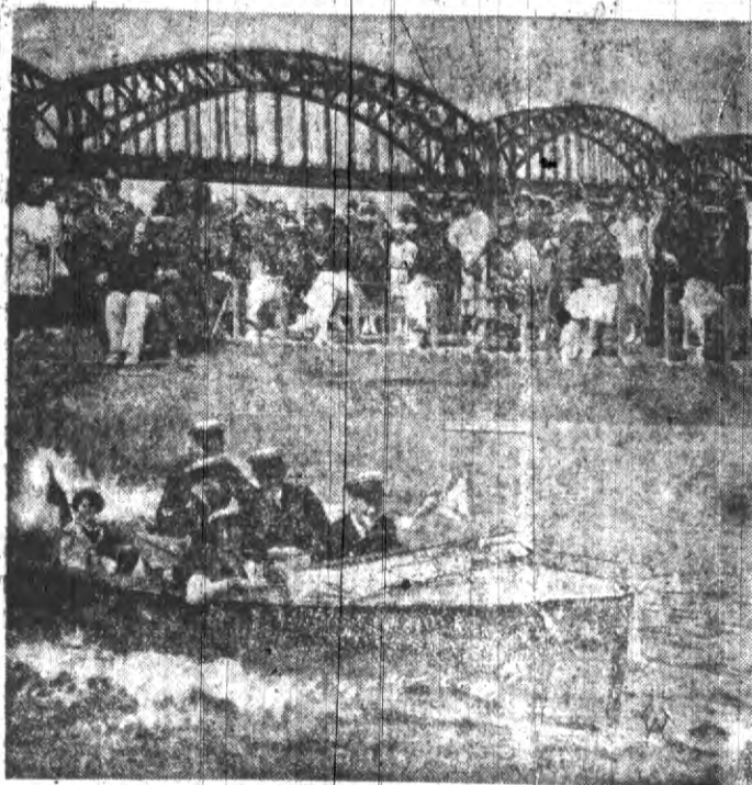
W ub. niedzielę na Przystani Oficerskiej Yacht klubu w Warszawie odbyła się w obecności Pana Prezydenta Rzplitej i członków rządu uroczystość otwarcia sezonu. Po podniesieniu bandery odbył się bierzesz nowych 20-u łodzi, 4-eh motorówek i 6-eh yachtów. Na górnym zdjęciu — Pan Prezydent Rzplitej, członkowie rządu i zaproszeni goście na uroczystości podniesienia bandery; u dołu — pan min. Spraw Zagranicznych Beck prowadził motorówkę, która fada p. premier Jedrzejewicz, min. W. Jedrzejewicz i marszałek Sejmu Świtalski.