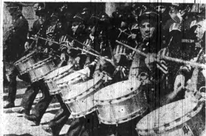
WIELKA REWJA W. F. I. P. W. W STOLICY W ub. niedzielę odbyła się w stolicy w obecności Pana Prezydenta Rzplitej wielka rewja Wychowania Fizycznego i Przystosobienia Wojskowego. Przed defiladą poczty sztandarowe wszystkich organizacji W. F. I. P. W. organizacyj sportowych i szkół społecznych uduły się na dziedzińcu Belwederski, celem złożenia hołdu Panu Marszałkowi Piłsudskiemu. Na zdjęciu — otwierający przemarsz do Belwedera oddział Kolejowego Przystosobienia Wojskowego z małymi doboszami na czole.