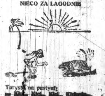
Turysta na pustyni