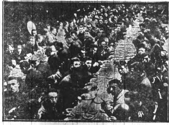
Bezrobotni ze Szkocji, uczestniczący w t. zw. „marszu głodowym” w Londynie, przy posiłku na końcowym etapie w ratuszu w Totenham.