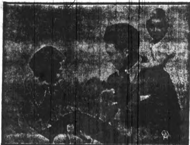
LEOPOLD III KRÓL BELGII Z RODZINĄ Leopold III król Belgii, królowa Astrid oraz dzieci ich książę Baudoin i księżniczka Szarlota.