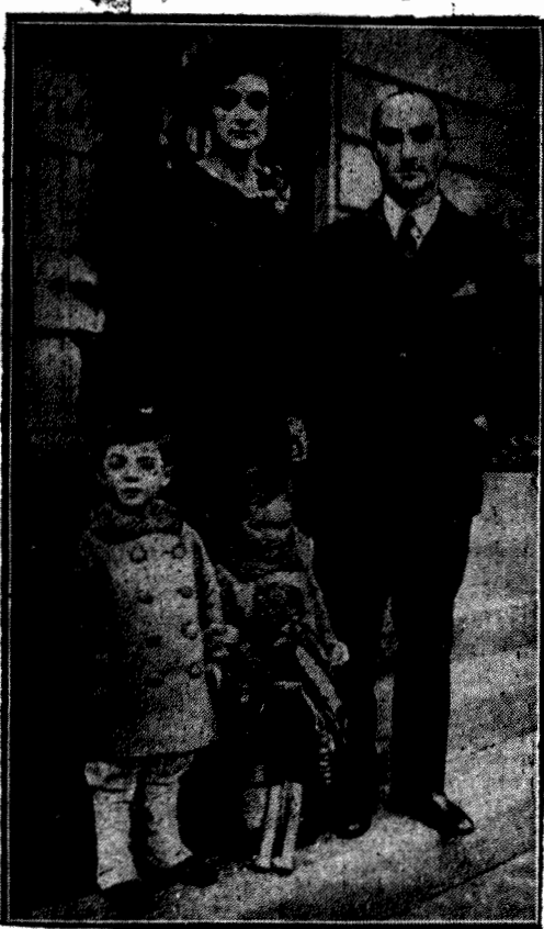
Na fotografii widzimy polskiego ministra pełnomocnego przy rządzie Stanów Zjednoczonych p. Ciechanowskiego w otoczeniu swej rodziny.