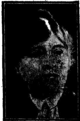
Pierwsza adwokatka na świecie