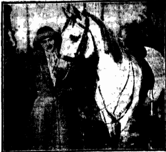
Księżniczka Ileana, córka pani-mającej przy królewskiej rumuńskiej, wzięła niedawno „do domu” po ukończeniu szkół angielskich w Londynie. Po powrocie pobiegła do swych ulubionych wierzchołków i przywitała się z nimi bardzo serdecznie.