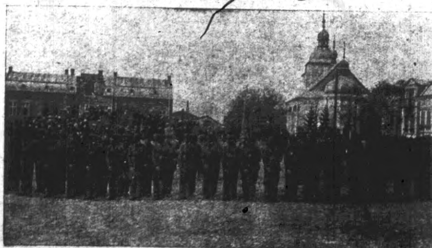
Kompanja strzelecka w Rohatynie.