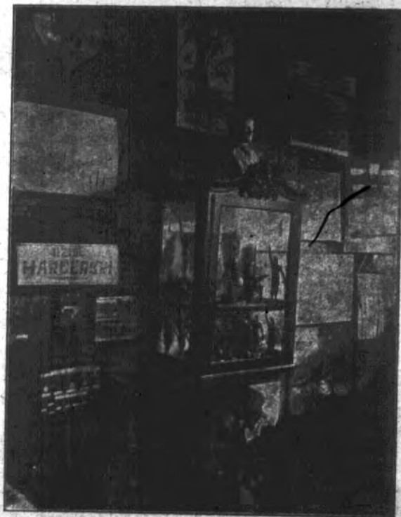
Fragment z wystawy regionalnej w Baranowiczach