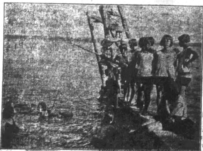
Pływania w obozie żeńskim P. W.