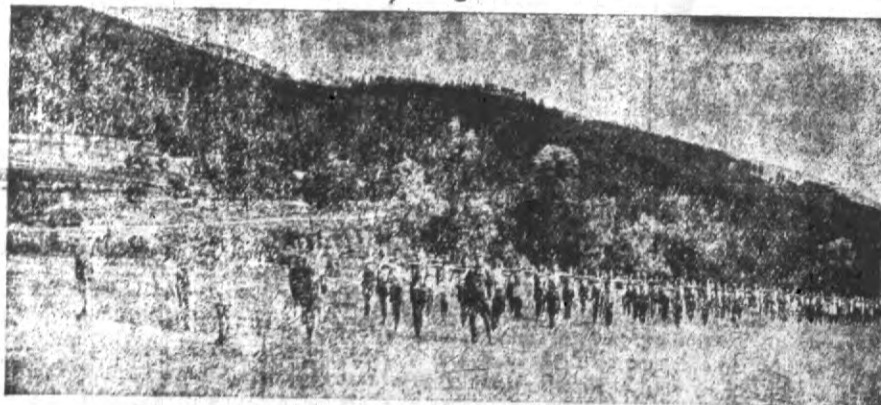
Ćwiczenia w obozie letnim w Węgierskiej Górze

miljon dolarów na miejscowe szkoły i szpitale. Następnie de Kay pojechał do Raguzy, gdzie znany był z niezwykłych wybrków, które spowodowały wreszcie przymusowy jego wyjazd. Między innymi szukający wrażeń finansista wyrzucił z balkonu pieniądze, a nawet wyraził życzenie zakupienia wszystkich okrętów, stojących w porcie. W maju de Kay przybył do Austrii, gdzie odwiedził najwybitniejszą miejscowość. Wreszcie przed kilku dniami nieoczekiwanie został aresztowany przez policję w Salzburgu w związku z olbrzymią aferą fałszerzy międzynarodowych czeków, w której to aferze wybitny finansista odegrał podobną jedną z głównych ról.