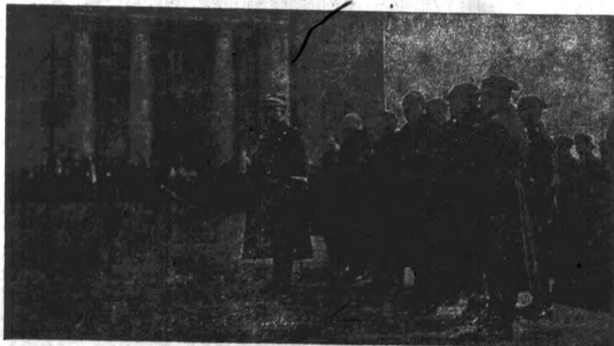
D-ca O. K. II gen. Dobrodzicki przemawia na uroczystości w Lublinie