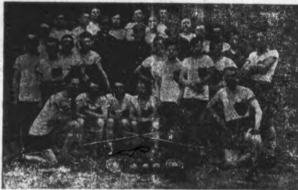
Zawody pływackie w Równem