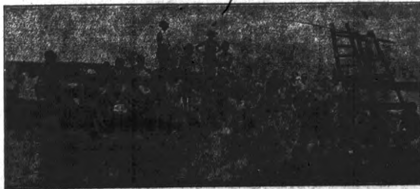
Chwila wypoczynku i rozkoszy naszych nadobnych grodnianek.

Skradziono książkę poborową tytuniową wydaną na imię Kazimierza Paszkiewicza z Hołynki. Książkę uniważnia się. 3-2