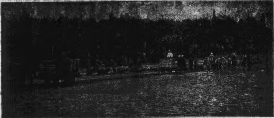
Wre gorączkowa praca przy budowie nowego stadjonu na terenie D. O. K. III w Podbrodziu.

Wzruszającym jest ten „gest“ ubogich z konników na kresach wschodnich, którzy wdowi grosz z puszkii żebaczkiej, oddają na dzieci polskie w Niemczech.