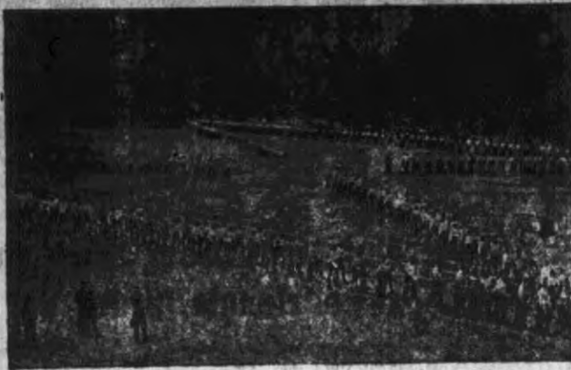
Oddziały P. W. i W. F. maszerują na ćwiczenia pokazowe.