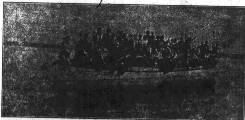
Grodnianie od spiekoty miejskiej szukają schronienia na Niemie, nie tracąc przytem dobrego humoru, jak to ilustracja nasza uwidocznia