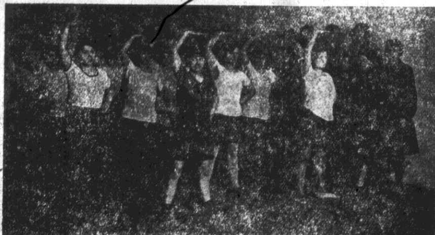
Ćwiczenia pokazowe kobiet.