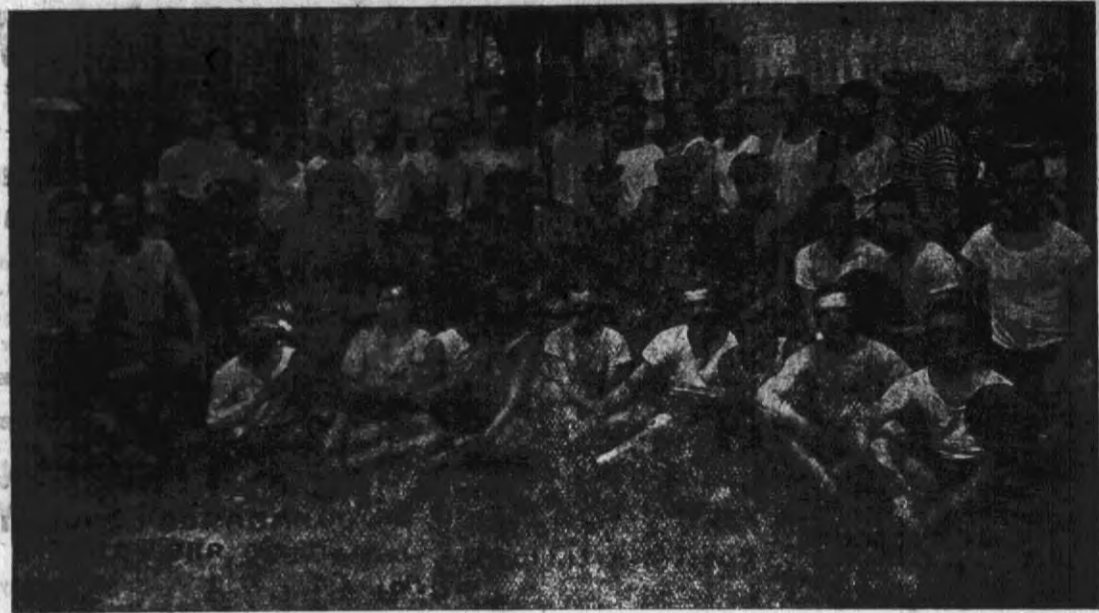
Kurs propagandy gier i zabaw w Lublinie