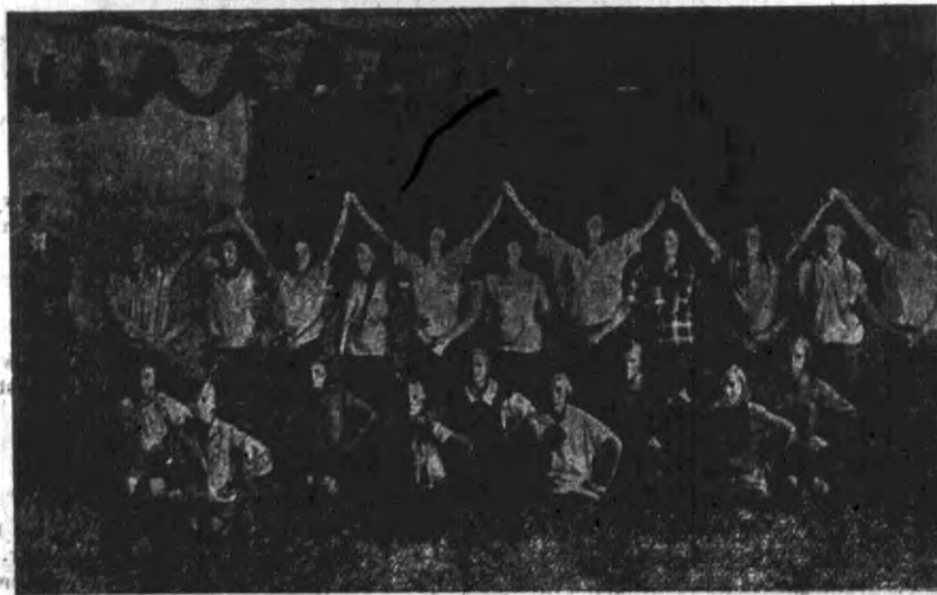
Lekcja gimnastyki wśród dziewcząt szkolnych