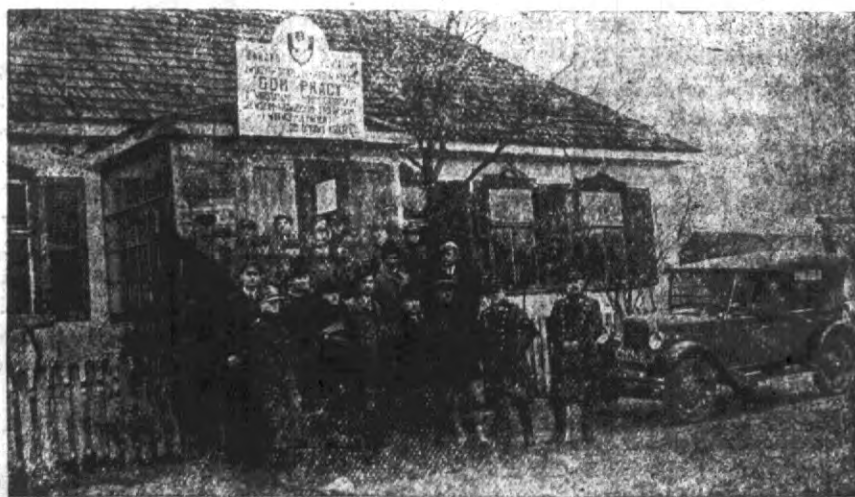
Dajemy 3 o fragmenty z Domu pracy w Wilejce. Zdjęcie powyższe przedstawia urząd majstrów i ucni.

W Grodnie przy ul. Orzeszkowej № 8, pokój 7 mieści się