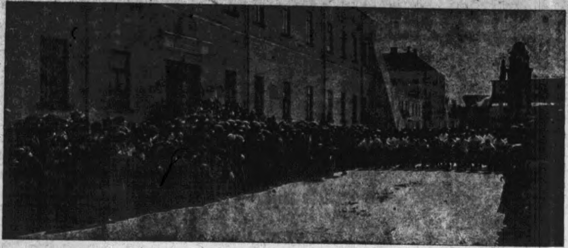
Przedstawiamy fragment z biegu na przelaj, który odbył się ostatnio w Zamościu