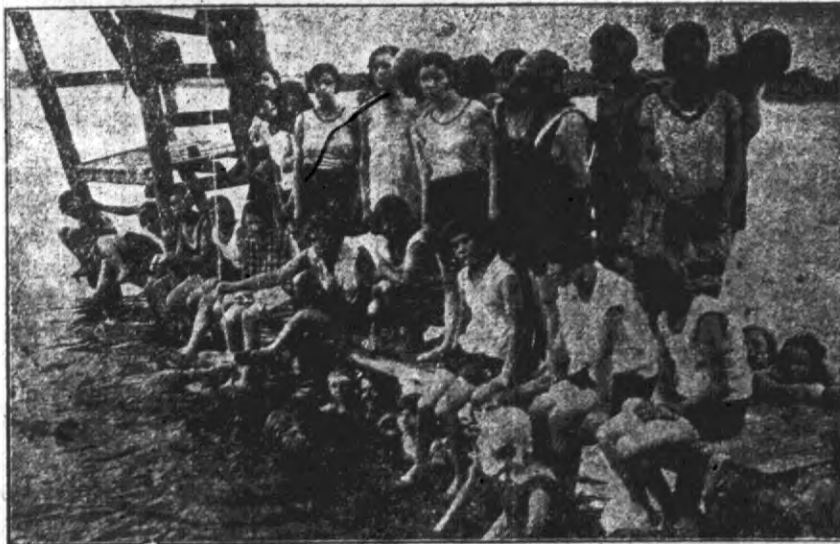
Sekcja pływania w obozie letnim prowadzonym przez Urząd Okręgowy P. W. i W. F. w Grodnie.