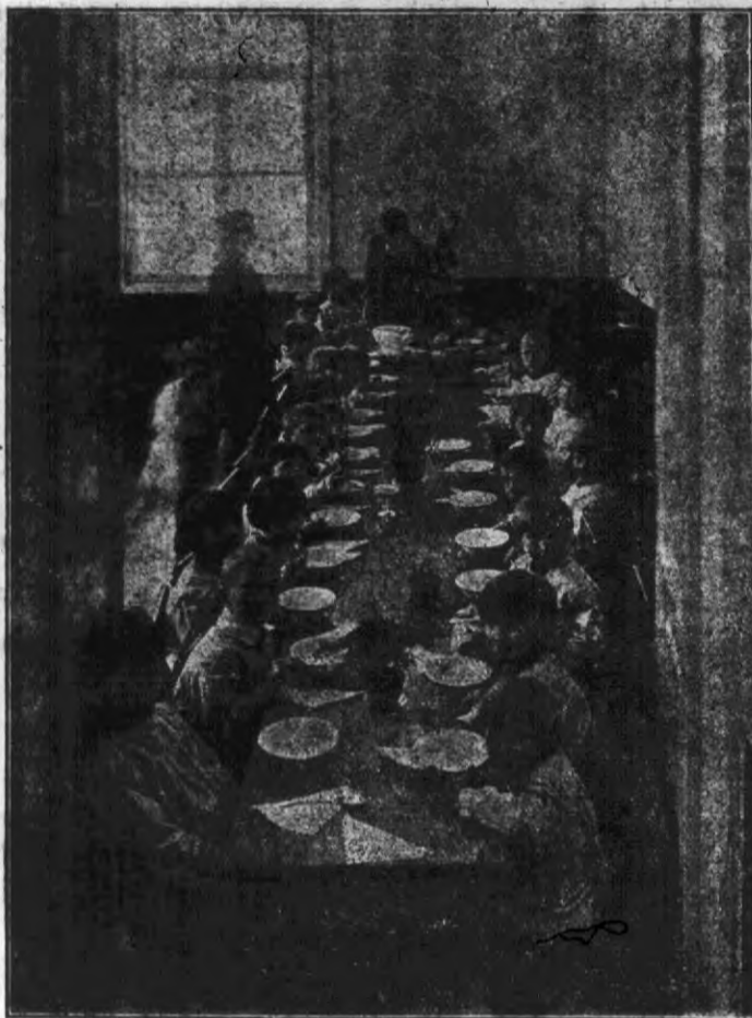
Podajemy już 3-ci fragment z przedszkola, Rodziny Wojskowej w Grodnie. Działka podczas śniadania