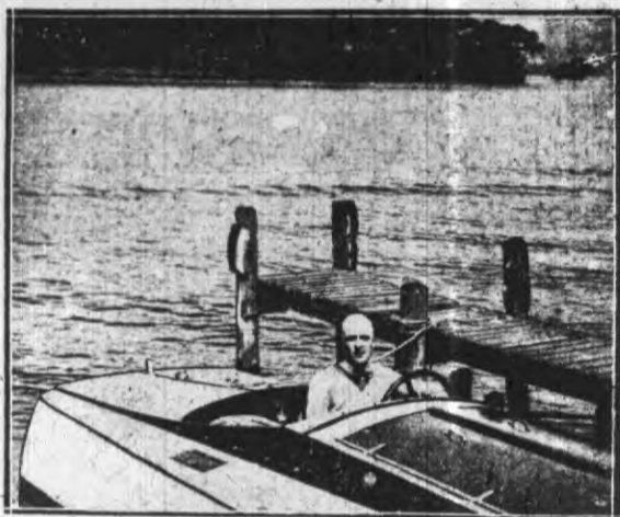
Mjr. Seagrave w łodzi „Miss England II” po treningu na parę dni przed tragiczną próbą bicia rekordu. Zdjęcie dokonano na falach jeziora Windermere, w który ch znalazł bohaterką śmierć.

Znakomity angielski sportowiec automobilista i kierowca łodzi, mjr. Henryk Seagrave zginął!