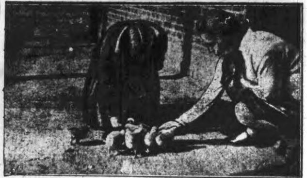
Cip, cip, cip! Kar mięte kurczątka.